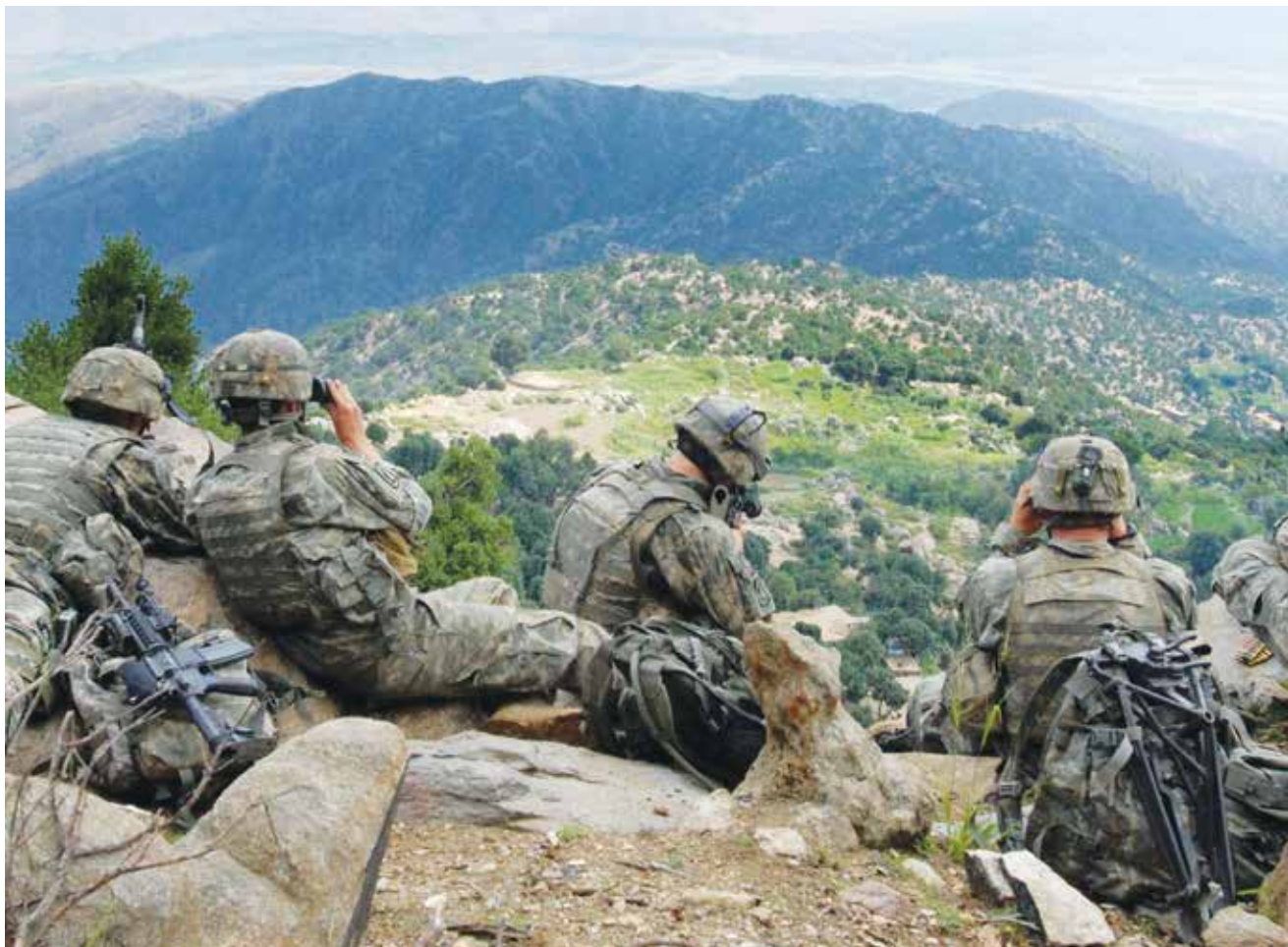
כוחות אמריקניים מתצפתים בחוז כנר באפגניסטאן, 2006. לפי השקפת צ"יני הכוחות לא יעזבו את השטח עד אשר "סיימו את העבודה", היא הזמן שיידרש אשר יהא, וההכרעה חייבת להיות מדינית.

להקצות משאבי עתק למימון הלחימה. בתרשים 2 מפורטים התקציב וכוח האדם שהשקיע הממשל האמריקני בלחימה בשנים 2001-2021; בתקופה שבה נוהלו שתי חזיתות במקביל הושקעו בלחימה 1.236 טריליון דולר. נוסף על כך בתקופה זו קצב ההחלפה של מפקדי פיקוד המרכז האמריקני 17 ושל מפקדי כוח הסיוע הביטחוני הבין לאומי 18 היה מהיר. כמו כן הגורמים שהוסיפו להעמיק את המשבר בארצות הברית באותה התקופה היו הקמת "המדינה האסלאמית" (דאעש), התפרצות המשבר הכלכלי העולמי ב-2008, פעולת ארצות הברית בלוב ועוד.