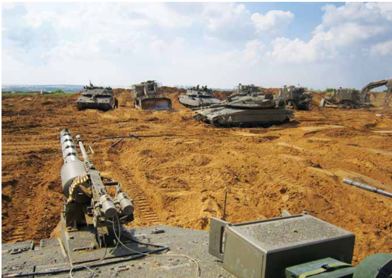
חטיבה 401 על גבול רצועת עזה, 2014. מלחמות הן חלק מן ההכרח האנושי והגאופוליטי, והן לבטח אינן מיותרות - כי הן חלק בלתי נפרד מהפרט ומהחברה האנושית.