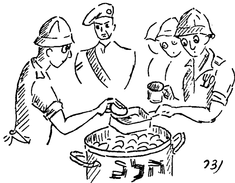
„ביצה אחת לאיש...“

החברה שמחים לחילוף עצמות, למאמץ הגופני. מוזר? אך בודאי גם מובן, לאלו היודעים אותנו כמות שהננו. היום היה לנו שיעור מסודר באימון הגופני. המד"ס התחיל אתנו כ"מפקד", אך עד מהרה עבר לפסים יותר נוחים. מיד עלה המתח, גבר הרצון. למדנו מעבר מכשולים שונים, בקפיצה, בהליכה, בשיווי משקל על קורות, ועוד. לסיכום השיעור נתן המד"ס לכל המחלקה לעבור את כל שלבי המכשולים — החל ממעבר על קורה, אל שיווי המשקל הגבוה, הקפיצה, מעבר התיל ושיווי המשקל הנמוך, והקציב לזאת זמן של 3 דקות. מיד החלה טיסה, כשאחד מזרז את השני, וכהרף עין עברה כל המחלקה את כל המכשולים המסובכים ושוב הסתדרה בשלשות. „לפי שעוני — שלוש דקות“ אמר המד"ס. „בשביל