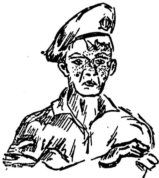
„הופיע איזה ג'ינג'י צעיר“

באנו למטבח הטירונים ב־5.30 בבוקר, ואת פנינו הקביל טוראי חייכני אחד שהסביר לנו מה נדרש מאתנו כאן. החלטנו החלטה נחושה „להיות בסדר“ ולהצטיין גם כאן כמו במטבח הקצינים. והנה הופיע איזה ג'ינג'י צעיר, בעל סרט אחד, מקומט ומלוכלך, על השרוול, צעק שתי צעקות, והחל קורא את שלוש הספרות האחרונות של כל אחד מאתנו. מסתבר שאותו יצור מוזנח, הוא לגבינו „המפקד“. גם לפקודתו אנו חייבים ב„כן המפקד“. נו, נקל לתאר איזו השקפה היתה לנו עכשיו על העבודה.