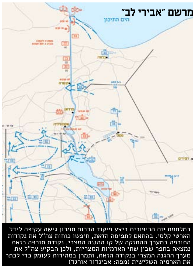
במלחמת יום הכיפורים ביצע פיקוד הדרום תמרון גישה עקיפה לידל הארטי קלסי. בהתאם לתפיסה הזאת, חיפשו כוחות צה"ל את נקודות התורפה במערך ההחזקה של קו ההגנה המצרי. נקודת תורפה כזאת נמצאה בתפר שבין שתי הארמיות המצריות, ולכן הבקיע צה"ל את מערך ההגנה המצרי בנקודה הזאת, ותמרן במהירות לעומק כדי לכתר את הארמיה השלישית (מפה: אביגדור אורגד)

הרעיון המבצעי של תוכנית "אורנים גדול" במלחמת לבנון הראשונה היה גם הוא תחבולני, ושמן בחובו שני יתרונות אפשריים בתוצאה הסופית. התמרון העיקרי, בהתאם לגישת לידל הארט, היה של אוגדה 162 שחדרה לעומק השטח בין מערך ההגנה הסורי בבקעת הלבנון ובין מערכי ההגנה של המחבלים בדרום לבנון ובאזור החוף. היעד המערכתי של האוגדה היה כביש בירות-דמשק. <