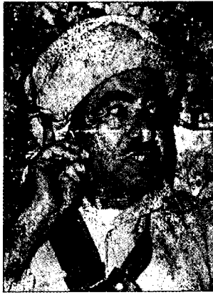
מולא מוצטפא ברזאני