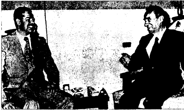
צדאם חסין (משמאל) ומישל עפלאק, מייסד הבעת'

הנשיא בכר וצאדם חסין (כידוע, הוקמה בסוריה, הנהגת החזית הלאומית המתקדמת" לשיתוף פעולה בדרג עליון עם גורמים פוליטיים מחוץ לבעת').