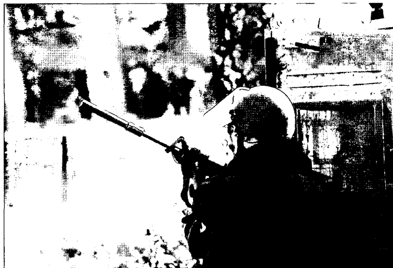
המפקד הטקטי נדרש "לחפש" את המפגש בתנאים הנוחים לו. לשם כך עליו לאתר את היריב הסמוי ולהעלותו אל פני השטח

ארגון חתרני הוא חמקן מטבעו, והמבנה שלו יהיה בדרך כלל לא קונוונציונלי. הוא שואף להיות כל הזמן בתנועה