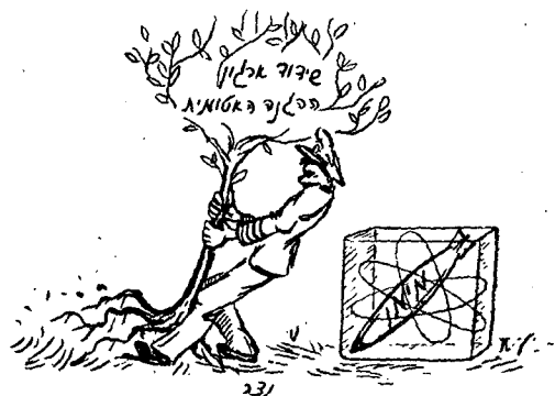
פצצת המימן מצריכה שידוד ארגונם, מן השורש, של כל אורחי המלחמה...

בצי-המלחמה מתקדמת המלאכה של בנית אנית כלי-נשק-מונחים נסיונית; אולם בטרם נשליך את כובעינו אל-על מרוב שמחה על כך, יהיה עלינו לשים את הלב לעובדה כי אין זו אניה הנבנית כולה מחדש, כי אם אניה המוקרת לתפקיד חדש, וכי הפלגות-המבחן שלה לא תחלנה, לפי התכנית, אלא ב-1956. אולם היות ואין אנו יכולים לסמוך בשלמות על עצמת-האויר-האסטרטגית, הכרת לנו כי יהיה לרשותנו גם צי-מלחמה אשר - "בצותא עם ציי הברית", כלשון ההודעה - יוכל לחפש אחר הכוחות הציניים של האויב ולהשמידם, ובאותו-זמן עצמו לשמור על השליטה בנתיבי התחבורה הימיים שלנו*. וכן עלינו לצמצם את צי-התעודה שלנו באשר לגודלו, אולם לשפרו מבחינת האיכות. אח-דות מן השפעותיו של הקו החדש על צבא היבשה כבר נרמזו בהודמניות קודמות. משך התקופה הי-אחרונה נתפרסמו הודעות על-כך כי יהיה על הצבא - באמצעותו של אימון, ובחלק על-ידי ויתורים על דברים שאינם הכרחיים או מקבילים זה לזה - ליהפך לנייד יותר, מהיר תנועה יותר, מסוגל ל-