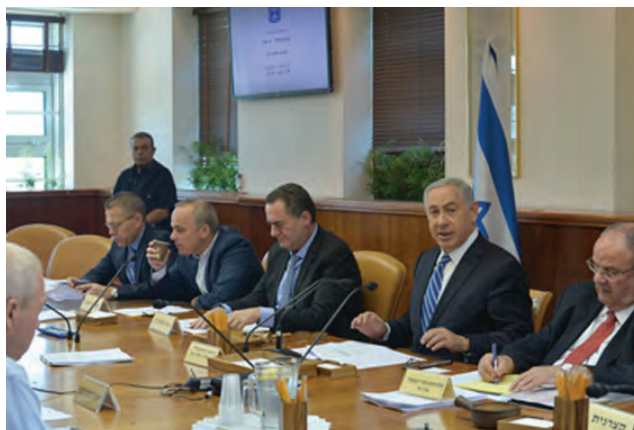
ישיבת קבינט, ינואר 2017. בתחילת הלחימה יש משמעות גם להגדרה הרשמית של המצב על-ידי הדרג המדיני.