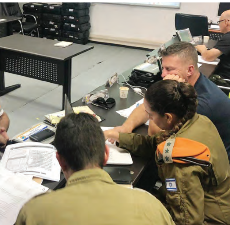
חדר מצב בפיקוד העורף. אורך הנשימה של הציבור נתפס לעיתים ככזה הקוצב את משך הזמן שבו התמרון יכול להתרחש.

מה משפיע על יציאה לתמרון, על המשכו או אפילו על החלטה לסיימו? כאן נכנס לדיון המונח "לגיטימציה" 21 . הדיון בנושא אינו חד-ממדי. ניתן לדבר על גורמים שקוצבים את זמן הלחימה ומפריעים לה מחד גיסא, ועל גורמים הרחופים ללחימה, לעיתים בניגוד לעמדת הדרג המדיני או הצבא, מאידך גיסא.