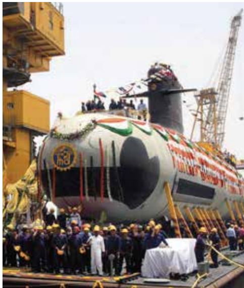
השקת הצוללת הראשונה מדגם סקורפיון, מייצור עצמי הודי

במובנים רבים, הודו מזכירה את ישראל, ותהליכים שונים שעברה ישראל בשנים האחרונות מזכירים את אלו שעברה הודו. ישראל הייתה מאז ומעולם מדינת אי, ולאחרונה פיתוח המים הכלכליים הפך להיות מחולל כלכלי משמעותי, המאפשר עצמאות אנרגטית הנסמכת היום בצורה כמעט מלאה על גז טבעי המופק מהים. האיזונים של הטרור הימי, שהודו נתקלה בהם לראשונה במהלך הפיגוע במומבאי ב-2008, מטרידים את מדינת ישראל מזה כמה עשורים, וחיל