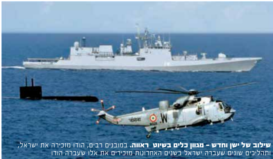
שילוב של ישן וחדש - מגוון כלים בשיט ראווה. במובנים רבים, הודו מזכירה את ישראל, ותהליכים שונים שעברה ישראל בשנים האחרונות מזכירים את אלו שעברה הודו

בשנים האחרונות בעת הפלישה לאוקראינה. ספינת דיג גדולה עשויה בקלות להפוך לאוניית ביון בתחפושת, והפעלה של כוחות בלתי סדירים או אירועים הנדמים לאירועי טרור הופכת להיות קלה יותר ככל שהנוכחות הסינית במרחב גדלה.