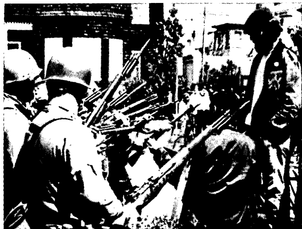
כוחות המשטר בעקבות פעולת חבלה של ה"טופמארוס"

את כיוונו של שינוי רדיקלי זה אין הגרילה העירונית יכולה לחזות: תכופות יהיה השינוי רחוק מרחק רב מציפיותיהם של מחולליו. ה"טופמארוס" הצליח להרוס את ה"שיטה" בארצו, על אף שעשה זאת בדרך של כישלונות ולא על ידי ניצחון, אולם במקום ה"שיטה" לא הוקמה "דמוקרטיה עממית", אלא "אורוגוואי של גנרלים". רז'ים דבריי תימצת לקח זה מניסיונו של ה"טופמארוס": "כאשר כרה קבר לאורוגוואי הליברלית — כרה ה"טופמארוס" גם את קברו שלו".