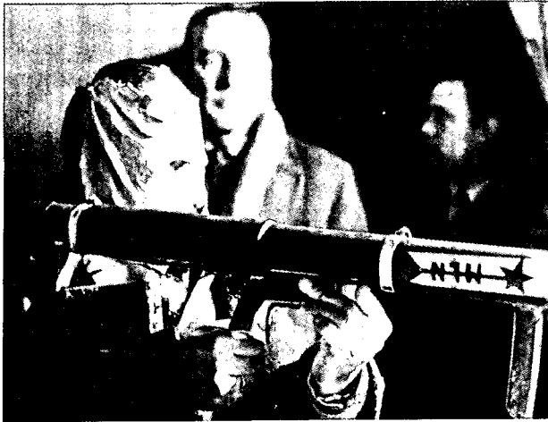
ניסוי משטרה בנישק מייצור עצמי של ה"טופמארוס"

באמצע ספטמבר 1971, במקביל לתחילת היערכותו של הצבא למערכה נגדו, הכריז ה"טופמארוס" באופן חד-צדדי על הפסקת אש