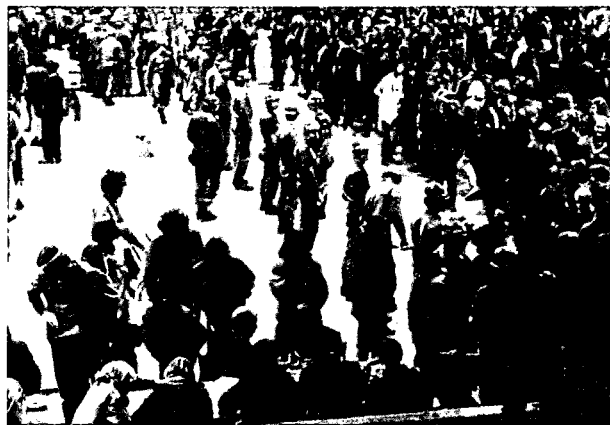
דיכוי הפגנות תמיכה ב"טופמארוס"

בשנים 1971-1972 הגיעה פעילות ה"טופמארוס" לשיאה. באמצע 1971 נתהווה למעשה מצב של "דר-שלטון" בו אכף הארגון "צדק מהפכני" ככל העולה על רוחו, בעוד השלטון אינו מסוגל להגן אף על בני חסותו הקרובים ביותר. יתרה מזו, נראה בעליל כי ה"טופמארוס" נושא עיניו אל השלב שמעבר למצב של "דר-שלטון", ומתכוון למתקפה בקנה-מידה נרחב. מסמכים פנימיים של הוועד הפועל ושל גוף המודיעין של ה"טופמארוס" התמקדו באותה עת בצורך "לעבור לרמה גבוהה ויעילה יותר של המאבק המזוין", כשהם "מתרגמים" צורך זה ללשון מעשית של פעולות מבצעיות, שתכליתן "להרוס ולהביס את האויב — מוראלי וחומרית".