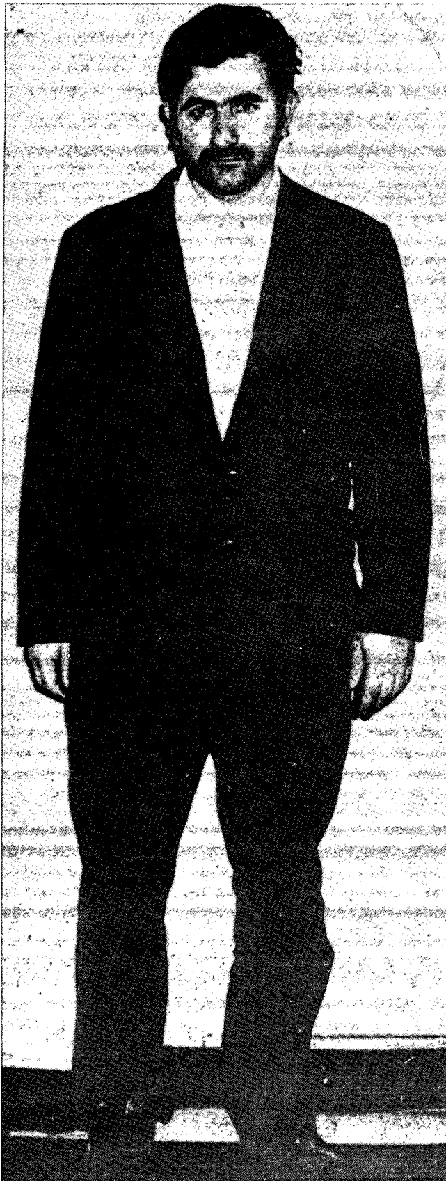
מנהיג ה"טופמארוס" ראל סנדיק בעת מעצרו באוגוסט 1970

"התנועה לשחרור לאומי" (MLN) באורוגוואי — ארגון הגרילה הנודע בכינויו "טופמארוס" — צמחה ופעלה על רקע ניגוד מעמיק והולך בין המערכת המפותחת של ביטחון סוציאלי, שנבנתה באורוגוואי מאז ראשית המאה, לבין כלכלתה הנחשלת והמתדרדרת של המדינה. משבר בענפי הייצור החקלאיים (בשר, צמר ומוצריהם) הוליד אינפלציה ואבטלה וגרם לתהליך מואץ של עיור, שהתמקד במידה מכרעת בעיר הבירה מונטבידאו, אשר בה התגוררו ב-1966 מליון וחצי איש, שהיוו 44 אחוז מכלל אוכלוסיית המדינה. הכנסות המדינה במטבע זר פחתו והלכו, ושוב לא הספיקו להוצאות מערכת הרווחה הסוציאלית אשר קרסה תחתיה במהירות. הסיוע הכלכלי מארה"ב ומקרן המטבע הבין-לאומית הותנה בפיקוח על השכר ועל המחירים — צעדים שפגעו בעיקר במעמד הבינוני. התנגשויות אלימות פרצו בין שובתים ומפגינים מקרב עובדי השירותים הציבוריים, סטודנטים ופועלים לבין המשטרה. ביוני 1968 הוכרז מצב חירום מוגבל, ולנשיא הוקנו סמכויות לפזר איגודים מקצועיים, להטיל צנזורה על העיתונות, ולעצור תעמלנים פוליטיים.