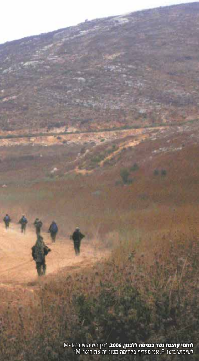
לוחמי עוצבת נשר בכניסה ללבנון, 2006. "בין השימוש ב־M-16 לשימוש ב־F-16, אני מעדיף בלחימה מסוג זה את ה־M-16"

באמצע שנות ה־80 של המאה ה־20, בעיצומה של לחימת הסובייטים באפגניסטאן, שאל עצמו ההוגה הבריטי בריגדיר ריצ'רד סימפקין את השאלה: מדוע כוחות מהפכניים מנצחים צבאות סדירים? סימפקין הגדיר את שתי הצורות החשובות ביותר של המלחמה היבשתית המודרנית: מלחמת התמרון והמלחמה המהפכנית. במלחמה של ישראל נגד חזבאללה ביבשה באו שתיהן לידי ביטוי. כך גם במלחמה באפגניסטאן שהתרחשה בשנות ה־80 בזמן שסימפקין כתב את ספרו, 2