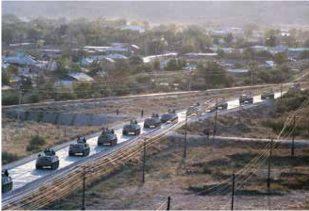
טור נגמ"שי BTR סובייטיים בדרך לאפגניסטאן, 1986. הסתגלותם של המגנאהדין לתנאי הלחימה החדשים הייתה קשה, אך הם הצליחו בכך