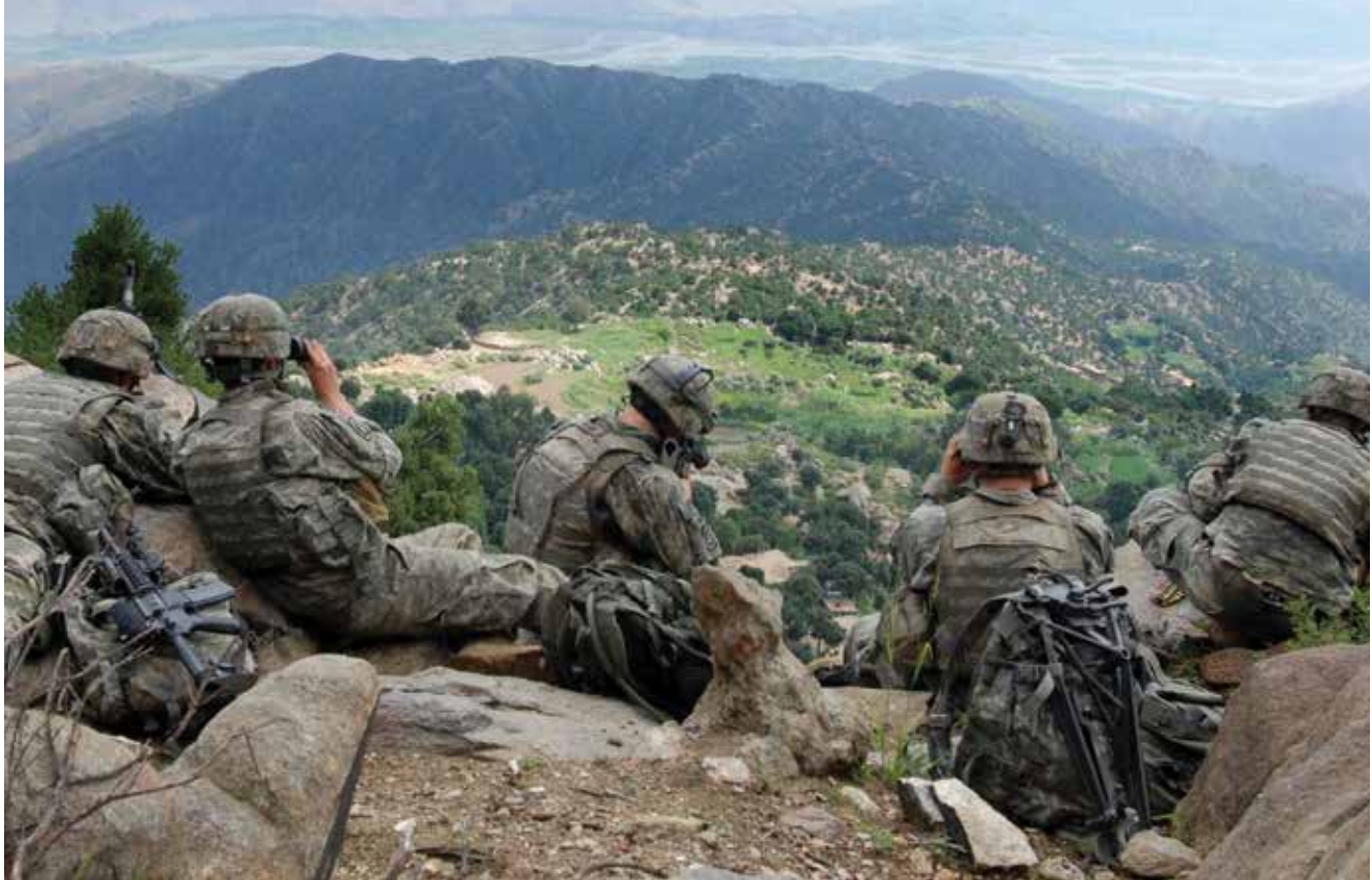
כוחות אמריקניים מתצפתים במחוז קוואר, 2006. המבצע בשאח־אייקוט נכשל בעיקר בשל סטייה קשה מעקרונות התמרון

חשוב ומה לא. הידע על האויב והבנתו אינו מצוי בספרי ההדרכה, ולא במסדי נתונים המוכנים מראש. הידע המודיעיני הוא תוצר של אדם. 4 הניסיון של האמריקנים להילחם באל־קאעדה בכוחות משולבים ב־2–13 במרס בעמק שאח־אייקוט נכשל. המבצע בשאח־אייקוט נכשל לא בשל יכולתם המבצעית הנמוכה של הלוחמים והמפקדים, אלא בעיקר בשל סטייה קשה מעקרונות התמרון: