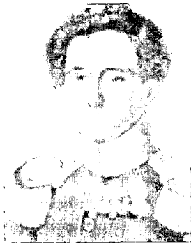
מחשבת קלאוזביץ ממוקדת במצב'א, והוא תמעט לטפל אפילו בנושא חשוב כמו מטה

הקשיים המיוחדים לו, בלי שים לב לזיקתו למאורעות האחרים". כלומר, הדוק- טרינה היא שנותנת אחידות וליכוד לבעיות העומדות בפני המדי- נה, אוריינטציה וכיוון כללי, ואילו בהעדרה נעשית כל בעיה לפרשה, אוטונומית לעצמה,