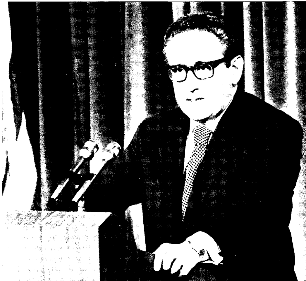
הנרי קיסינג'ר, שר החוץ האמריקני לשעבר: "אנרגיה רבה מבוזבזת כדי להחליט היכן אנו מצויים, יותר מאשר לאן אנו הולכים"

ו"תפקוד" מופתיים, כשהכול פועלים כאיש אחד, אך הם מבצעים מדיניות של שטות ותפלות. טיב המדיניות הוא צריך להיות בראש מעיינם של קברניטים.