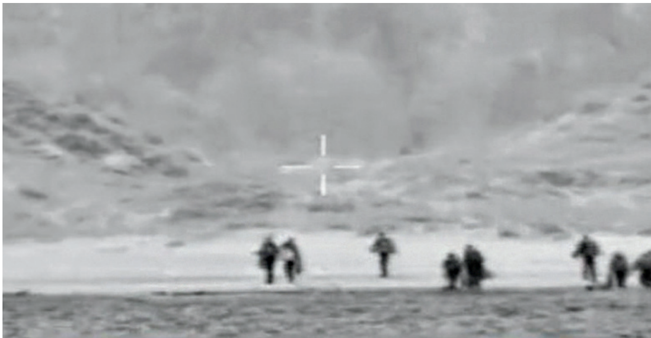
בצילומים: כוח משיטת 13 בצור במהלך מבצע "יער הנגב", 4 באוגוסט 2006. גם אם המבצע היה מסתיים בתפיסת הבכיר, ההישג לא היה נחשב ככל הנראה לתרומה ברמה האסטרטגית או המערכתית

מול מטרות חשובות, ובהקשר זה במיוחד ב"ציד אדם") התרחשה בעיראק בשנים 2005-2006, כאשר JSOC - בפקודו של גנרל סטנלי מקריסטל - הוביל תהליך מיזוג רחב של יכולות הפקת המידע של ארגוני הביון הממשלתיים האמריקניים, דוגמת הסי-איי-איי והאן-אס-איי, עם יכולות השטח הקרביות של היחידות המיוחדות שלו. תהליך זה הביא את JSOC לפתח יכולות מרשימות של סגירת מעגלי מודיעין