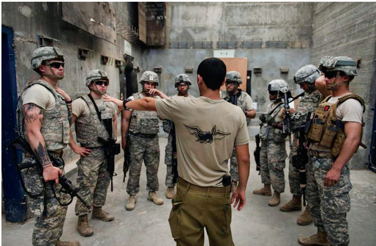
לוחם מיחידה מובחרת בצה"ל ולוחמים מיחידת הסיור של המרינס במהלך אימון משותף, אפריל 2005. לוחמי כומ"מ חייבים להיות בעלי יכולת לפעול בתנאי חוסר ודאות קשים, תוך שימוש בנחישות, יצירתיות ואלתור

ואילצה אותו להעביר לצורך הגנת העורף החשוף כוחות ומשאבים שנדרשו לו בחזית. 23 מקרה מודרני של מודל לחימה כזה התרחש גם במהלך מלחמת עיראק השנייה, ב־2003. שם, לצד הכוחות הכורדיים המקומיים, תקפו צוותי הכומתות הירוקות את צבא עיראק בצפון המדינה. הצוותים הורכבו בעיקר מקבוצת הכוחות המיוחדים העשירית שכללה שלושה גדודים מבצעיים של צוותי אלפא מהכוחות המיוחדים של הצבא האמריקני, ורכיב תמיכה אווירי מיוחד של קבוצת המבצעים המיוחדים. עובדה זאת הציבה את העיראקים מול בחירה קשה ביותר, ובעקבותיה רותקו לחזית כוחות רבים שהיו נחוצים מאוד להגנה בחזיתות העיקריות נגד צבאות הקואליציה שפלשו מדרום וממזרח. חשוב לציין שהכוחות המיוחדים פעלו בשטח הכורדי לבדם, במציאות שבה אף כוח קונוונציונלי לא יכול היה לפעול בשל הסיורב הטורקי לתת לכוחות אמריקניים לעבור בשטח המדינה.