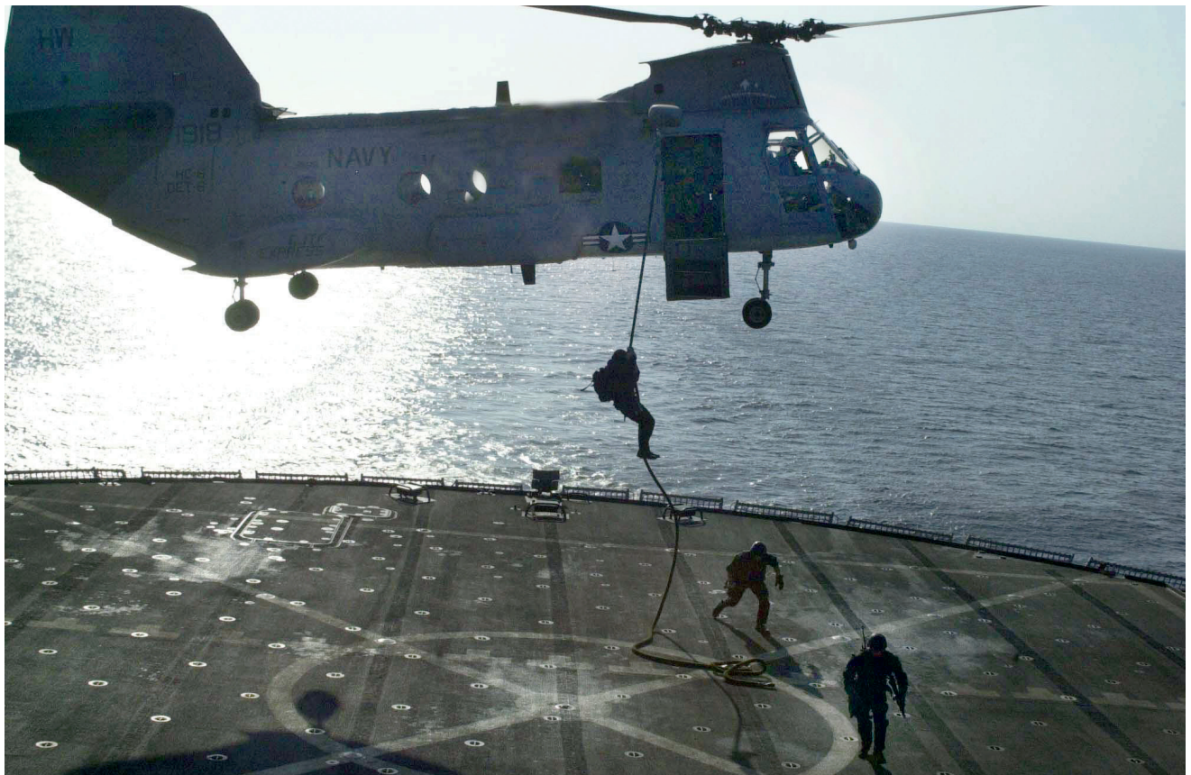
לוחמי "אריית הים" יורדים ממשוק, 17 בינואר 2003. יחידות מיוחדות מורכבות מכוחות קטנים של חיילים קרביים מיומנים במיוחד, שעברו הכשרה ברמה הגבוהה ביותר

הזדמנויות; ככלי במלחמות מידע (מודיעין מיוחד, השפעה, לוחמה פסיכולוגית, הונאה).