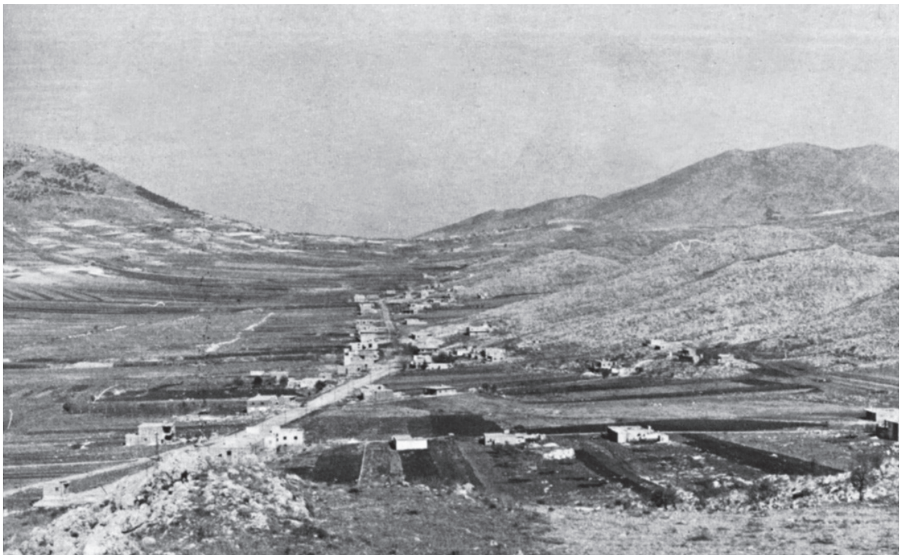
מבט על בקעת הלבנון - אזור הלחימה של הגיס הצפוני

הפעלת הגיס במלחמת שלום הגליל הוכיחה את נכונותה של התפיסה שלפיה אין דרך מעשית לנצח במלחמה ללא מהלכים קרקעיים וללא השתלטות על השטח וכיבושו. כמו כן היא הוכיחה שאין תחליף לכוחות המשוריינים