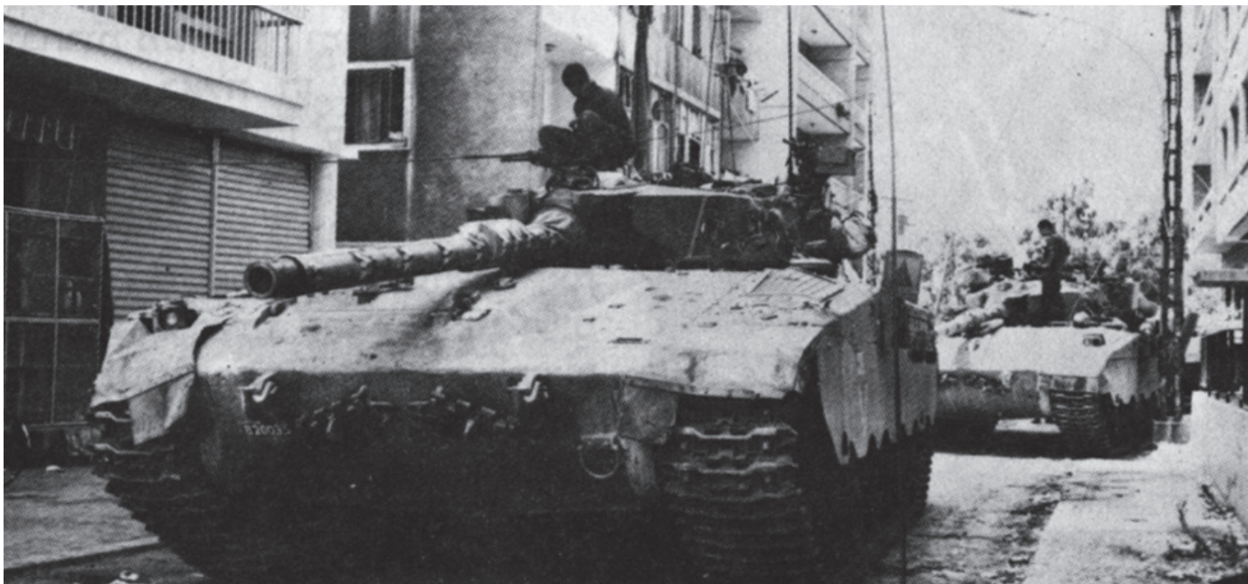
טנקי מרכבה בשטח בנוי בלבנון | כל המאמצים להימנע מלתקוף את הסורים עלו בתוהו

בלבנון בעוצמה כוללת של שלוש אוגדות בפיקוד עצמאי של גיס משוריין ומוכנות לפרוץ לבקעת הלבנון הצפונית.