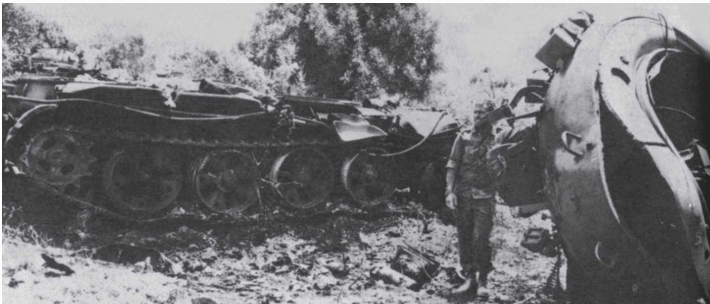
טנק T-62 שצריחו הועף | הכוחות הסוריים איבדו בקרבות השריון 233 טנקים ו-65 גנמ"שים

הכישלון המבצעי חשף תחלואים רבים כגון צבא בלתי מקצועי ולא מאומן הסובל ממחסור במנהיגות ובפיקוד, צבא שאינו דבק דיו בהשגת המשימה בכל תנאי, צבא שתרבות הלחימה שלו השתנתה, ובמידה מסוימת אינו רואה בהכרעה ערך עליון.