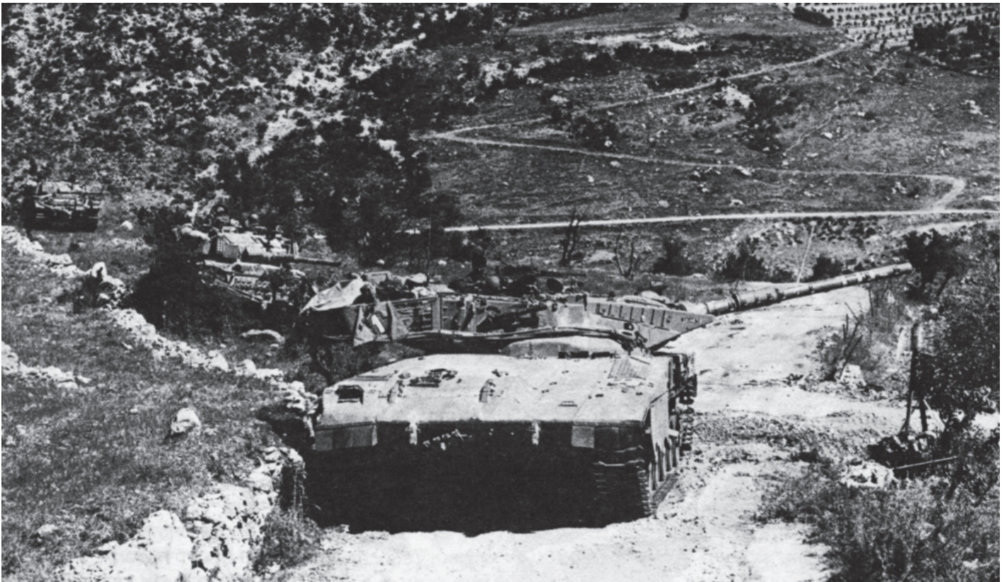
מרכבה במלחמת שלום הגליל: טבילת אש ראשונה לטנק הישראלי החדש | הרעיון המרכזי בתוכנית הגיס היה - בשלב הראשון - לתקוף ולהשמיד את השריון הסורי בגזרה המזרחית של לבנון באמצעות ריכוז האוגדות למתקפה גיסית נגד דיוויזיה משוריינת מספר 1

We are the champions, my friends And we'll keep on fighting till the end We are the champions We are the champions No time for losers Cause we are the champions of the world.