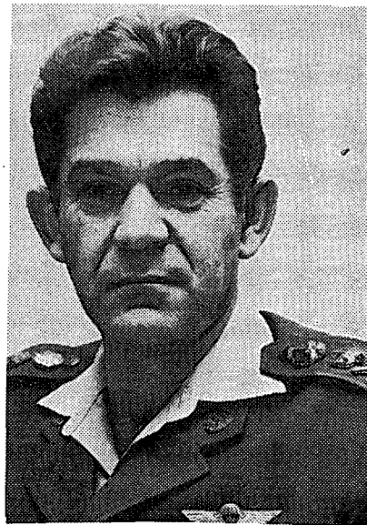
הרמטכ"ל, רא"ל דוד אלעזר. הערכה מוטעית במאי 1973

מאי לאוקטובר עמדו לרשות אמ"ן ארבעה חודשים ומידע חשוב לתקן טעותו.