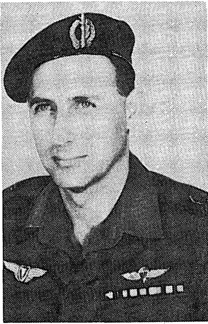
האלוף אלי זעירא — הטעות של אמ"ן היתה דוקא במאי