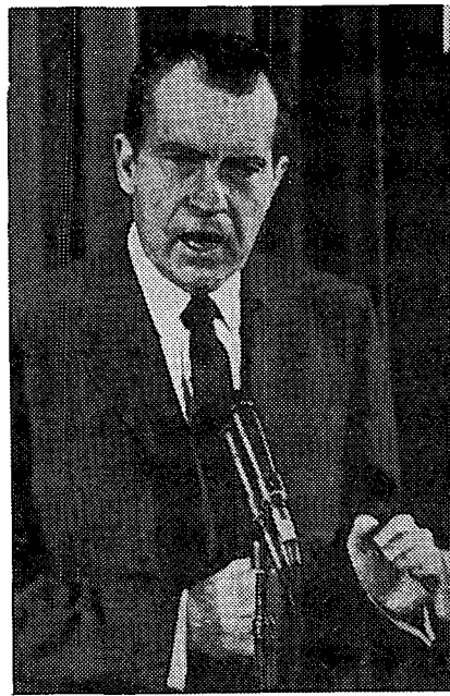
ריצ'רד ניקסון, הנשיא — ברה"מ וארה"ב הגיעו ב-1972 להזדקקות הדדית גבוהה