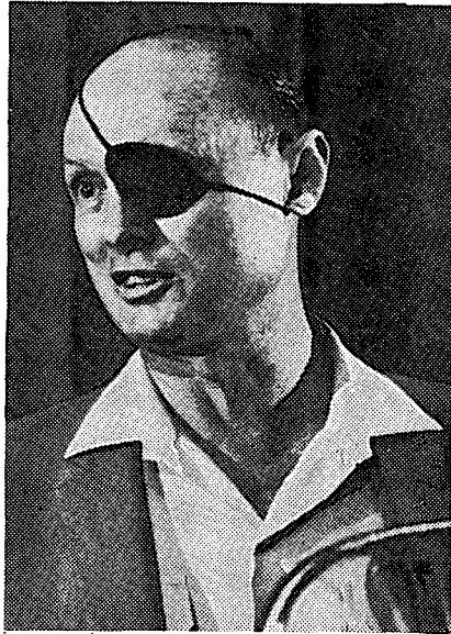
שר הביטחון, משה דיין