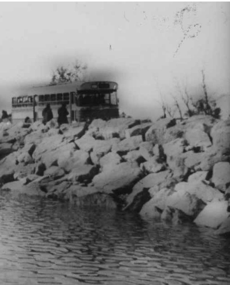
לוחמי חטיבת הצנחנים במהלך מלחמת יום הכיפורים

מאחורי. הסתובבתי לאחור בתא המפקד וראיתי שהוחל"ם נפגע בבת אחת מכמה פצצות אר.פי.ג'י שנורו עליו במקביל. מיד עם הירי על הוחל"ם שהתפוצץ על כל יושביו, החלה אש תופת משני צדי הציור על הטנק שלי ועל הטנק השני". 3