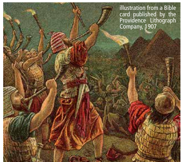
illustration from a Bible card published by the Providence Lithograph Company, 1907