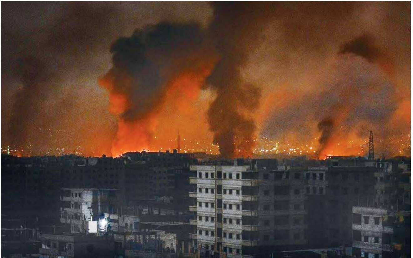
חמה, במהלך תקיפה שיוחסה לחיל האוויר הישראלי, 30 באפריל 2018. על־מנת לעמוד במטרותיה, המב"ם כוללת כמה מאמצים מתואמים המופעלים במקביל, ורק שילוב של כולם יכול להביא להישג מערכתי שלם ורחב

העלייה הדרמטית בכמות האירועים המבצעיים ובעצימותם בשנתיים האחרונות במסגרת המב"ם, הפכה את מצב השגרה ללחימה רציפה ורבי־זירתית המעצבת את הזירה האסטרטגית. שינוי בתצורת המערכה מחייב המשך התאמה תפיסתית וארגונית כדי למצות את ההישגים המבצעיים בעת הזו