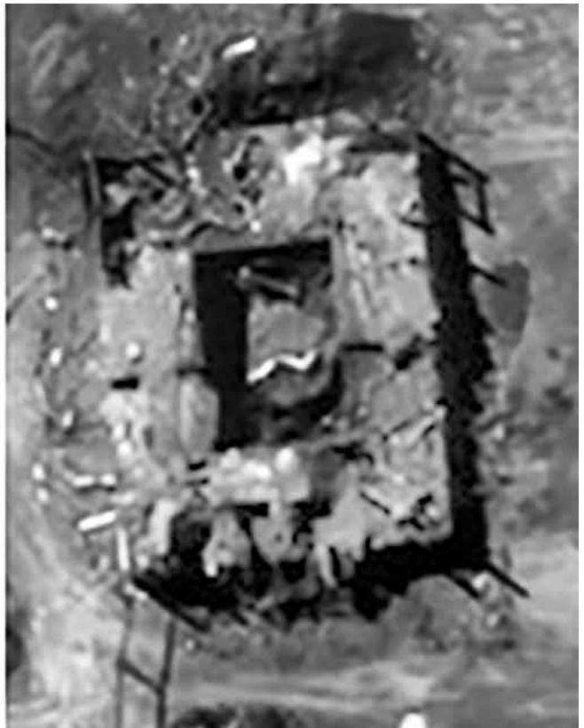
תצלומי לוויין של הכור בסוריה במהלך מבצע "מחוז לקופסה". המבצע הוא דוגמה מובהקת לפעילות מנע התקפית

ישראל במרחב לבנון. זירת הלחימה במב"ם היא אפוא כל מרחב שבו ניתן להשפיע על האויב. הייחוד של המערכות הנוכחיות הוא בכך שישראל פועלת כיום מבצעית בכמה חזיתות בו בזמן, מול מגוון אויבים ובמערכות שונות: