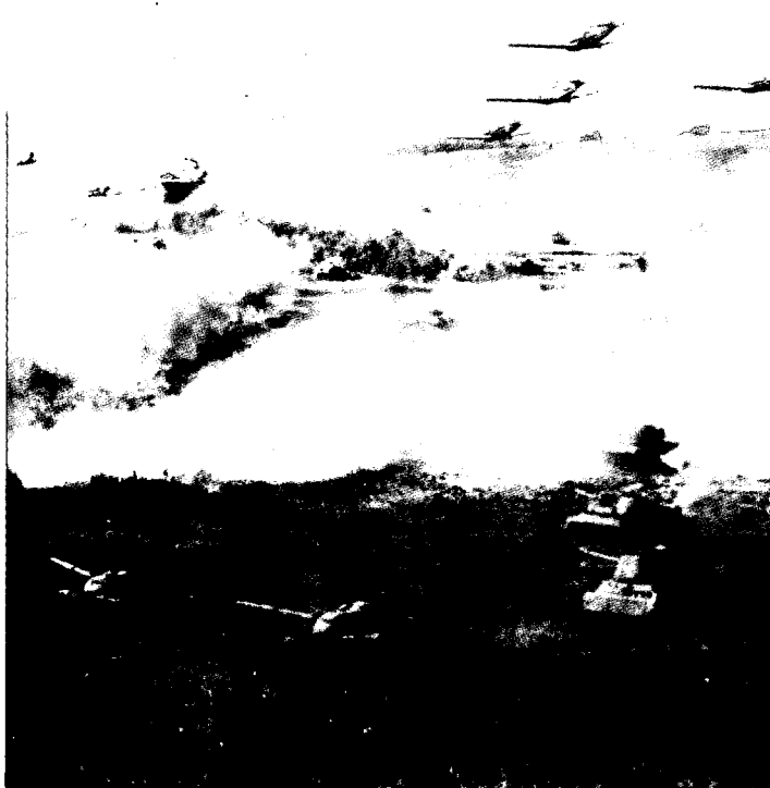
הסובייטים נשענו על מסת כוחות מסתערים, שנתמכו בארטילריה ובכוחות אוויר טקטיים