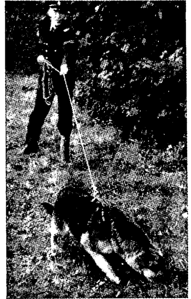
כלב עיקוב בפעולה

ממנה (כגון: ריח הנעליים ומשחת־ה־נעליים של מטביע העקבות, הצמחיה, הר זבל או הזפת שע־ליהם דרך וכדומה), וזאת — לא רק ב־עקבות טריים אלא אף בעקבות שמאו הטבעתם עבר זמן ניכר יחסית (בדרך כלל לא יותר מאשר 24 שעות). ברור, כי הכלב אינו מסוגל לדעת איזה עקב־בות עליו לחפש, ור־כאן תפקידו של ה־גשש, לספק לו את "קצה החוט", כל־מר — להצביע על