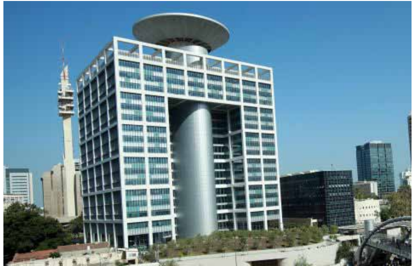
"בניין הכוח", משרד הביטחון במחנה הקריה | המחסור במשאבים מחייב בחירות קשות בין קשת המתארים שאליהם יש להיערך שכן בסופו של דבר לא ניתן להיערך לקראת כולם

המחסור במשאבים מחייב בחירות קשות בין קשת המתארים שאליהם יש להיערך שכן בסופו של דבר לא ניתן להיערך לקראת כולם. מהסיבה הזאת נדרש תהליך מתוכנן של ניהול סיכונים. ניהול הסיכונים אינו רק החלטה בנוגע לסיכונים שיש לקחת, אלא קביעת פעולות לגידור הסיכון: הגדרת תוכנית ומדדים לזיהוי מוקדם של התממשות חלק מהסיכונים וגיבוש תוכניות מגירה לשינוי ההיערכות. אכן מלאכתם של מתכנני בניין הכוח היא מורכבת ביותר ומחייבת שילוב מושכל בין אנשי המודיעין, התכנון האסטרטגי, התכנון המבצעי והתכנון הכלכלי כך שיתאפשר למפקד לקבוע מהם הכלים שיהיו ברשותו בשנים הבאות.