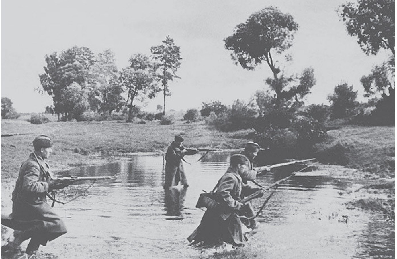
חי"ר סובייטי מסתער, אמצע ספטמבר 1941 | למרות תכוסות קשות נלחם הצבא האדום היטב וכעזו רוח ולא הראה שום סימן שבכוונתו להפסיק להילחם

● ההיערכות הסובייטית בגזרת החזית הייתה לא טובה ונגזרה כנראה מהתשתית של מחנות הקבע ומההנחיה המדינית להיערך בהגנה קדומנית. 12