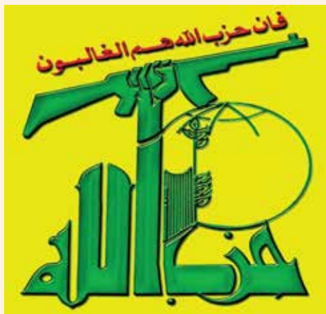
סמל חזבאללה: מעל הנשק ציטוט הסיפא של הפסוק הקוראני (5:56): "הם מחנה אללה והם הגוברים".

האדם המאמין פועל בהכוונתם של שני המצפנים באופן דיאלקטי, ובתוך מערכת מתחים שמחייבת פעולה יום-יומית ליצירת סכרון ושינוי משקל בין שני המצפנים. עולם ומלואו תלוי בתבונה זו שמסבירה מצבים שנראים, מנקודת המבט המערבית, ככפל לשון. לדוגמה החלטות ועידת הפתח ב'2009, ששיקפו מתח בין הכרזות בעלות גוון קיצוני ובין החלטות בעלות גוון מתון. בהכוונת שני המצפנים ביטאו ההכרזות