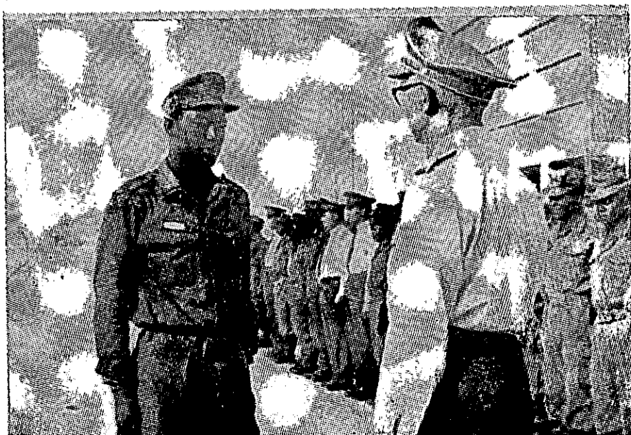
סיוע גרמני — הכשרת פלטים בבסיס הדרכה של חיל-הנדסה במערב-גרמניה

● קרו מקרים, שצבאות קיבלו שריון, למרות שטרם פיתחו