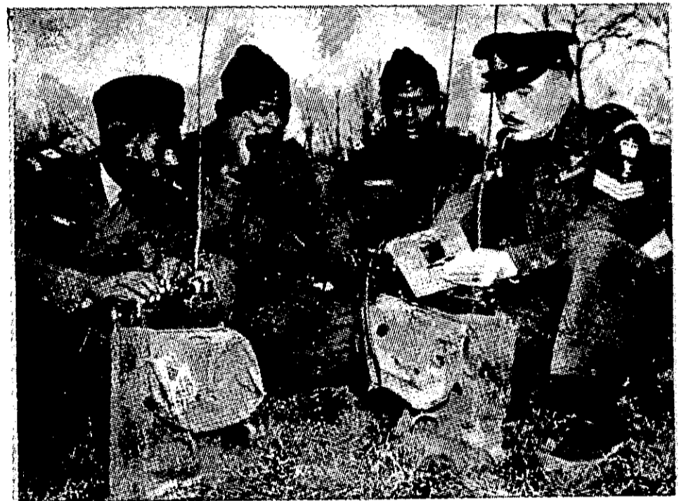
סיוע קנדי — הכשרת צוערים טאנזאניים בבי"ס לקשר

הסיבה — חשש מתפיסת השלטון על-ידי הצבא. אפשר להביא לדוגמה ארץ מזרח-אפריקנית, הזקוקה לצבא גדול וחזק, כדי לפתור בעיות בטחון אקטואליות בגבולותיה. למרות זאת היא מחזיקה צבא קטן בלבד, שכן נתנסתה נסיון מר בעבר הלא רחוק. מסקנה: במקרים רבים נוטים אמנם העמים האפריק-איים להעלות את קרנם בעולם על-ידי בנין הצבא והרחבתו; אולם לרוב הם עושים זאת בזהירות רבה. גם כשנוקטים בקו ההרחבה — לא תמיד הצרכים המעשיים של העמים הם הקובע-עים את התכנון. בנית חיל-אוויר סילוני או צי-מלחמה הפכה