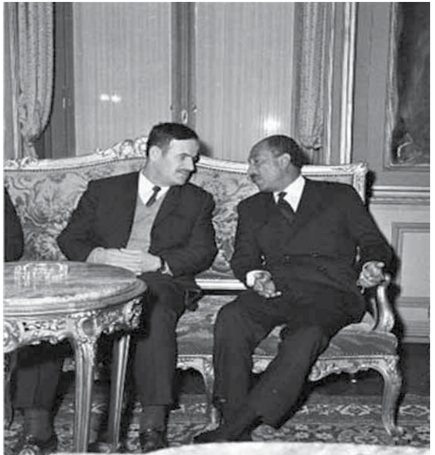
סאדאת ואסד בפגישה לקראת המלחמה | באוקטובר 1972 החליט נשיא מצרים, אנואר סאדאת, "לשבור את הקונספציה" ולצאת למלחמה נגד ישראל גם ללא השגת יכולות אוויריות משמעותיות

1. מצרים לא תיזום מלחמה נגד ישראל (כדי לכבוש לפחות חלק מסיני) אם לא תהיה לה יכולת מספקת לתקוף בעומק שטחה