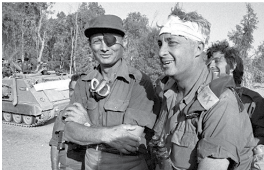
מפקד אוגדה 143, אלוף אריאל שרון, עם שר הביטחון משה דיין במלחמת יום הכיפורים | בנאום ב-19 בספטמבר 1973 אמר שרון: "ישראל עומדת בפני שנים שקטות מבחינה ביטחונית... אנו נמצאים במצב הטוב ביותר מבחינה ביטחונית, ובגבולות הנוכחיים אין לנו בעצם כל בעיות ביטחון".

"להערכתנו, הסבירות שסאדאת יחדש ביוזמתו את האש לקראת הסתיו נמוכה ביותר (בפועל אנו נוטים לבטל לגמרי את הסבירות שיפעל בדרך פעולה זו)". 18