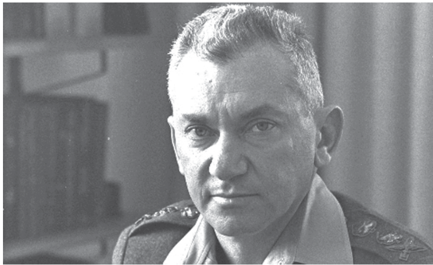
הרמטכ"ל חיים בר-לב | רב-אלוף חיים בר-לב קבע במסיבת עיתונאים ב־31 דצמבר 1971 כי "האפקט המצטבר של מפלת המצרים במלחמת ההתשה הביא אותם לידי חוסר התלהבות למלחמה, לידי אי-ראיית תכלית בחידוש המלחמה"

למלחמה היא נמוכה, העריכו שר הביטחון, הרמטכ"ל וראש המוסד כי גברו הסיכונים וכי פני המצרים למלחמה. לאור זאת הועלתה רמת הכוננות בצבא (שכונתה "כחול לבן"). בסופו של דבר לא פרצה מלחמה במאי ו"האלרמיסטים" (זהו כינוי הגנאי שהוצמד למתריעים) "נוצחו" על ידי מי שהפכו לזרם המרכזי באמ"ן.