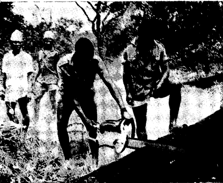
איכרים מכפר קואופרטיבי בבירוא יער

אי רווחים בטוחים: בניית בתים להשכרה (לדיפלומטים ולמומחים זרים); תחבורה בין-עירונית (באוטובוסים מאול-תרים); ומוניות, בעיקר בעיר-הבירה. בנגי מליאה מן-ניות, "שירות", המקשרות בין שכונותיה המפוררות. המוניות שייכות בדרך-כלל לפקידים-משלה, ומופעלות על-ידי נהגים שכירים. גם בתחום זה החלה הממשלה משליטה סדר ולא מזמן הפעילה לראשונה שירות אוטובוסים מודרני משלה. הקמ"אים המעטים הפונים למסחר — מצטמצמים בעיסוק במסחר הזעיר או ברוכלות; אך לעתים קרובות מגלה אתה, לאחר שיחה קצרה, כי החנווני אינו בן-הארץ כי אם יליד אחת הארצות השכנות, אשר התאזרח בקמ"א והגיע למס-חר — כדרכם של זרים מאז.