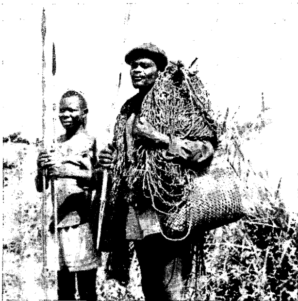
ציידים במחוז לוביי

הקמ"אים מכניסי-אורחים ואוהבי-אדם מטבעם. אורח כי יודמן לאחד הכפרים — יזכה תמיד למיטב האירוח שבגדר האפשר. לעתים תמה אתה על הקלות בה נכונים הקמ"אים לשכות מעשי-עוול שנעשו להם במשך עשרות שנים, למעשה — עד לפני שנים לא-רבות. אין זאת אומרת שאין בנמצא כל הסתייגות וחשדנות כלפי זרים. אולם הקמ"אים נוטים, על-פירוב, לדון את האדם לפי ערכו ולא בהתאם לצבע-עורו. יתכן כי יחסם זה נובע מהטפתו של בוגנדה, מיסדה של המדינה ונשיאה הראשון, שאף בימי המאבק כנגד השלטון הקולוניאלי, הבחין הבחן-היטב בין הפקידות הקור לונאילית, המשרתת אינטרסים נצלניים, לבין נציגיה של „התרבות הצרפתית בת-האלמוות“. סיסמתו של בוגנדה „האדם הוא אדם“, הפכה להיות מעין כינוי-חיבה להומניסט גדול זה, שהשפעת תודותיו ניכרת בקמ"א גם כיום. בהקשר זה מעניין לציין, כי במשך שנים אחדות היו שני חברים צר-פתיים באסיפת-הנבחרים של קמ"א, ואחד משגריריה בהווה, הוא צרפתי שנתאזרח בה.