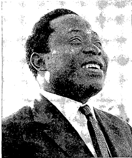
ברתלמי בוגנדה, נשיאה הראשון של קמ״א

בוגנדה היה סוציאליסט על־פי דרכו־שלו; הוא השתייך לאותו זרם שהוגדר כ„סוציאליזם אפריקני” על־ידי ליאופולד ס. סנגור, נשיא סנגל, ועל־ידי הוגי־דעות אפריקנים אחרים, ועיקרו: שוויון סוציאלי קיים באפריקה זה מכבר, אולם אין הוא אלא שוויון של עוני ומחסור. על־מנת לחלק את „העוגה הלאומית” חלוקה צודקת — יש ליצור אותה תחילה. לשם כך הכרח, בראש־וראשונה, להשיב לאדם האפריקני את