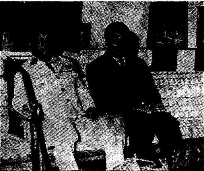
נשיאה הנוכחי של קמ"א, קולונל בוקסה, והנשיא המודח, דוד זאקו, במסיבת עיתונאים מייד אחרי ההדחה.

בשל כל אלה מייחסת ממשלת קמ"א חשיבות מיוחדת לארגון הנוער במסגרות חינוכיות ולפיתוחה ושכלולה של החקלאות.