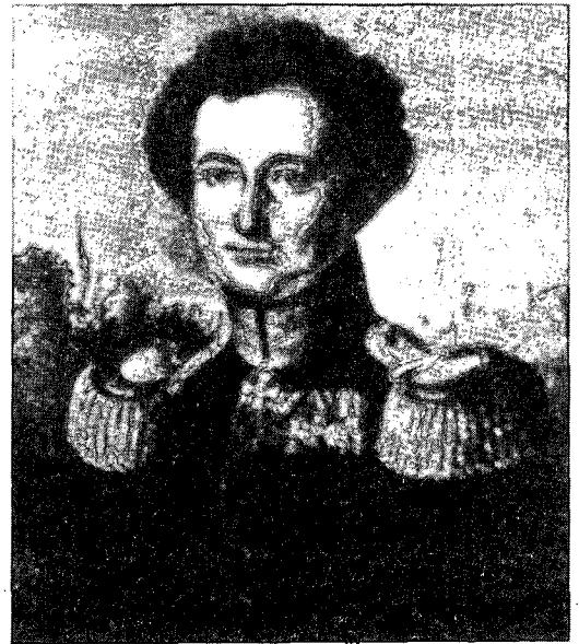
קארל פון קלאוזוויץ

השוואה של עקרונות המלחמה במדינות שונות – ארצות הברית, בריטניה, צרפת, סין וישראל – שתמציתה מוצגת בטבלה 1, מצביעה על טווח מסוים של שונות. מטבלה זו ניתן ללמוד, כי הבדלים בנתונים הגיאר אסטרטגיים, בתרבות הלאומית ובלקחים ההיסטוריים מתבטאים בשונות מסוימת בהדגשים של צבאותיהם. אך אלה הם יותר בבחינת וריאציות על אותו נושא, מאשר הבדלים מהותיים. כך, לדוגמה, הסינים רואים בגיוס לאומי עיקרון בסיסי; הרוסים הכניסו לרשימת