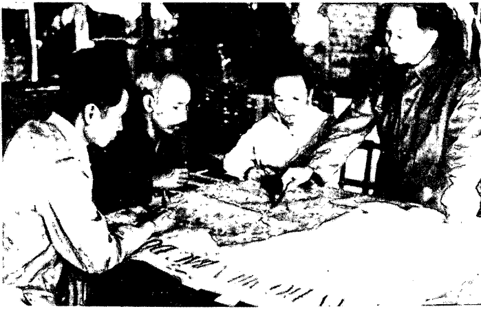
גנרל וו נגוואן גיאפ

אִי־היכולת להפריד בין הפוליטיקה לבין המלחמה, ובין המלחמה לבין הלחימה.