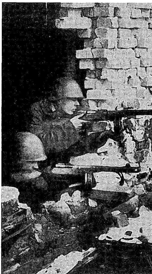
סטלינגרד סימלה את המלחמה במזרח במלחמת העולם השנייה

אולם, בין מושגיהם הבסיסיים ביותר מתקיים מתח ניגודי משלים, דוגמת המתח הניגודי המשלים הקיים בין "חינוך" ל"הוראה" במערכת המושגית של החינוך, או בין "צדק" ל"סדר" במערכת המושגית של המשפט.