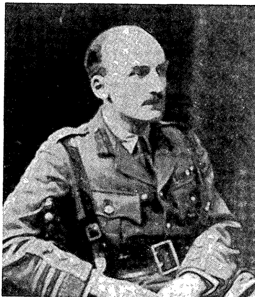
ג'ון פ"צ פולר

בעקרונות המלחמה, שהוא כתב לנסיך, כבר ניכרים גם נציניהם של המרכיבים הניגודיים – משלימים האחרים של חשיבתו, המגיעים לגיבוש רב יותר ב"על המלחמה". בעיקר, חשובה בהקשר הזה הבחנתו המשלימה בין החשיבה במושגים תיאורטיים של הטיפוסים האידיאליים ובין החשיבה באמצעות המושגים כמקיימים יחס של מסמן-מסומן עם ישויות ועם אירועים ממשיים. לתיאוריה יש אצל קלאוזביץ זכות קיום כשלעצמה, כניגודיות משלימה למציאות, המאפשרת את פירושה ואת הבנתה, ולא רק כפועל-יוצא של התכנסות לחוק כללי, שניתן להסיקו מהסתכלות בממשי.