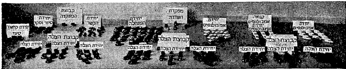
מדגם של גוף הג"א נייד חדש שכמוהו מוקמים והולכים עתה בבריטניה מתאמת בראשית 1953. השדרה כוללת 152 כלי רכב ותקן של 860 איש. השדרה מתחלקת לקבוצות שכ"א מהן מורכבת מכמה יחידות