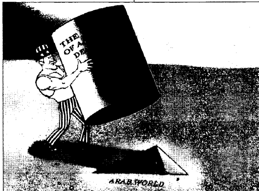
חוסר התאמה בין מושג הדמוקרטיה האמריקני לבין עולם הערכים של העולם הערבי ("אל-ג'זירה", 6 ביוני 2003)

האמריקנים לביסוס ההערכה לגבי הצלחה עתידית במזרח התיכון. מילים רבות שוגרו מפי ראשי הממשל האמריקני ותומכיו בגנות "אלה הגורסים כי הערבים פגומים גנטית ואינם ראויים לדמוקרטיה ולחירות". הגדילה לעשות קונדוליסה רייס, היועצת לביטחון לאומי של הנשיא בוש, אשר טענה בפני קהל אפרו-אמריקני באוגוסט האחרון, כי כפי שאסור היה לקבל את הטענה שהשחורים בארה"ב אינם מוכנים לחירות, כך אסור לקבל את הטענה שאזרחי המזרח התיכון אינם שותפים לשאיפה האנושית לחירות.