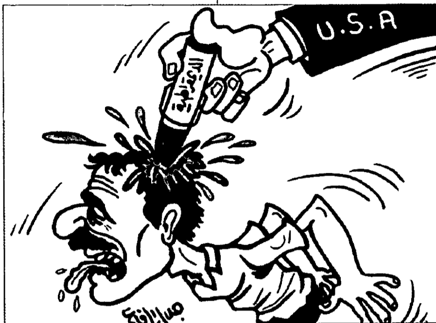
הניסיון האמריקני "לצרוב" את הדמוקרטיה בתודעת הערבים - בעיניו של הקריקטוריסט ג'יאל ארפאעי ("אדוסתור" הירדני, 21 ביולי 2003)

בעקבות ניתוחו הידוע של חוקר מדע המדינה סמואל הנטינגטון ("התנגשות הציוויליזציות"), נראה כי