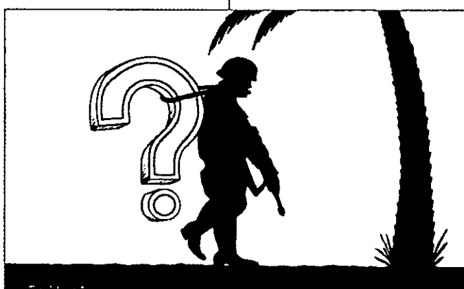
"אראמי" (ירדן) - 11 ביולי 2003

דפוסי התרבות והפוליטיקה הבסיסיים באיזור ומוכנה להשקיע למען חזון היסטורי זה, המוגדר כמרכיב מרכזי באסטרטגיית הביטחון הלאומי שלה, משאבים רבים לאורך זמן ("מחויבות לדורות", כלשון היועצת האמריקנית לביטחון לאומי), או שמא "עקשנותם" של בני המזרח