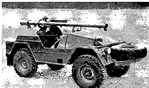
למעלה — תמונה מס' 3 ; למטה — תמונה מס' 4

מית" — כי אם על גיפ ("משאית 1/4 טון") שבדי, המאפשר כמובן ניידות הרבה יותר רחבה.