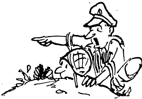
הבקר מודיע למפקד כי הלן רואה כ..."

למשך זמן נסיגתו של הכוח האויב מן היעד; לאחר נסיגה זו מתירים להתקפה כי תמשך כלפי דמיים והתנפצויות מופעלות-ממרחק.