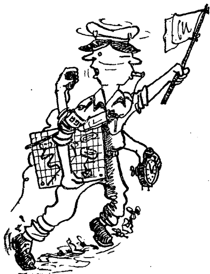
למספר ראשים ולחצי תריסר ידים זקוק הבקר הבכיר

הקיץ הוטל על חטיבה-מוגברת לערוך התקפת-נגד בחבל ארץ גבעי, לתפוש יעד-סופי על צומת-דרכים חיונית לאחר חיסול הכוח המגן עליו, להת-ארגן מחדש תחת לחץ אויב, ולעמוד בפני התקפת-נגד בעצמת-חטיבה. כל זאת — בתנאי נחיתות-כאויר, אשר חייבו תנועה, התפרסות והתקפה —