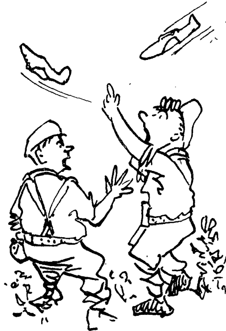
זה לא גיט, זה מוסטאנג