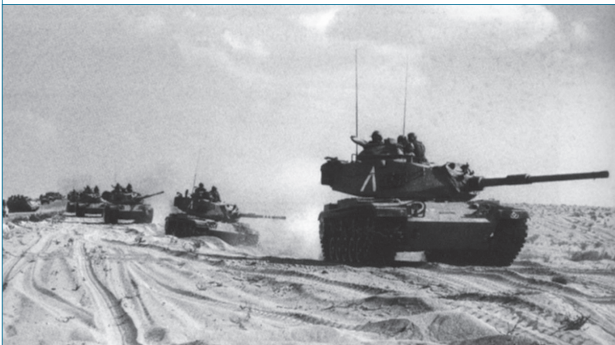
קלאוזביץ הציע להימנע מקרבות הכרעה גדולים