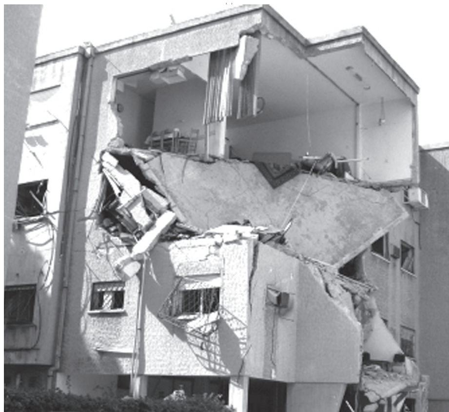
הפגיעה בעורף הישראלי במלחמת לבנון השנייה | יש להגביר את מיגונו של העורף כדי שיוכל להמשיך בשגרת חייו גם בעיתות מלחמה