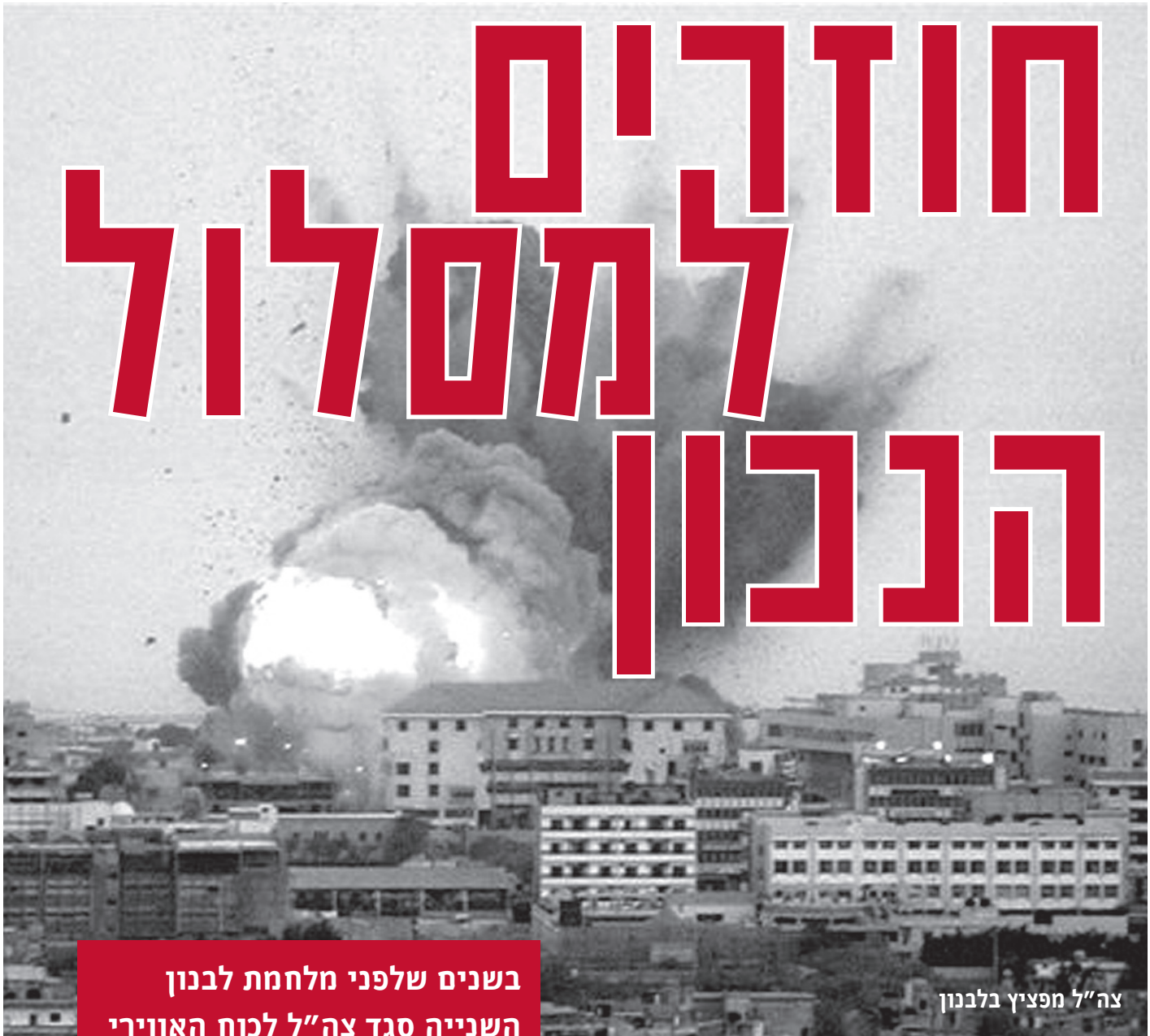
צה"ל מפציץ בלבנון

בשנים שלפני מלחמת לבנון השנייה סגד צה"ל לכוח האווירי וביטל את חשיבותו של צבא היבשה. זו הייתה סטייה חמורה מתורת הלחימה הקלאסית, וכעת יש לחזור אליה 1