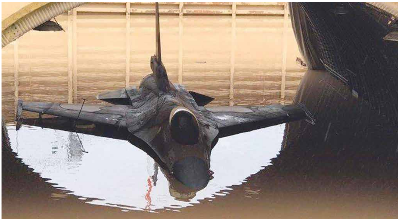
מטוס מוצף בבסיס חצור. תחילה הוטלו על האירוע מגבלות צנזורה ביטחונית, אך כבר למוחרת פורסמה באמצעי התקשורת תמונה המציגה את המטוסים שנפגעו.

המידע של המפקדים הבכירים לעומת החיילים הצעירים. שנית, הממד הפיזי - חוסר המגע הישיר בין המפקד הבכיר ובין אחרון הפקודים. המפקד הבכיר מפקד על מערכת גדולה עם מוטת שליטה מורכבת. אנשיו פזורים בשטח גאוגרפי רחב, בשונה ממנהיגות ישירה וקרובה שבה המפקד הזוטר נמצא בקשר קרוב, יומיומי ואינטימי עם פקודיו.