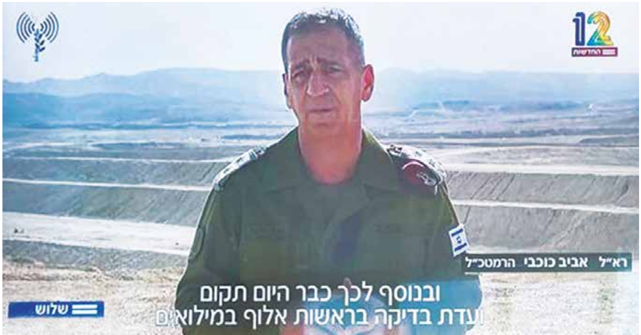
הרמטכ"ל בעת אירוע הירי באגוז בריאיון לערוץ 12. התפיסה הפיקודית לפיה אין לדווח דבר "החוצה" (אלא אם אין ברירה) אינה מקדמת מערכת יחסים של אמון עם הציבור.

המציאות הסוערת בעיניים פקוחות" ולקחת אחריות, ובעת משבר לקיים תקשורת אמפתית, שקופה ואותנטית. לפיכך המפקד נדרש להתייבב נכוחה מול המצלמה, לעצב, להשפיע, להנהיג ולהסביר את מעשיו.