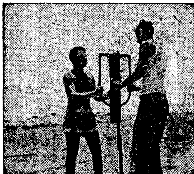
בהיאחזות: ביצור הספר — הלכה למעשה

החינוך להתיישבות אינו נפגם במסגרת הצבאית; ואילו החינוך הצבאי אינו מסטר כמלוא הנמה מן היצר להגשמה חלוצית. אדרבא, בנח"ל נתמזגו ער"כים אלה. הנח"ל משמש להם "מכנה משותף". אכן, אין הוא מסתפק בתפקיד זה של "מכנה משותף" לשני צרכים חינוכיים אלה בתורת עקרונות בלבד;