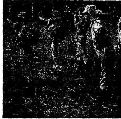
באימונים: מחזיקת אנכי

להיות משותפים. צבא המקיף כה רבים: חיילים בשרות פעיל מכאן, חיילי מילואים מכאן — נחוץ שישען על העם כולו. העושים במלאכת יומם בידם האחת — יחזיקו את השלח בידם השנייה; ואם גם לא יחזיקו בשלח יום-יום, צריך שיהיו מאומנים