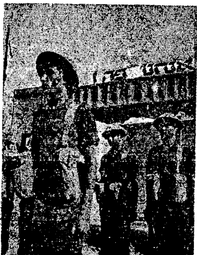
חג העליה להיאחזות

יש הטוענים שהיסוד ההתישבותי שבנח"ל פוגם באופי המשימות הצבאיות של הנח"ל ובמילויין; ואילו חוגים אחרים טוענים שהמסגרת הצבאית ה- מחייבת והמטילה מרותה על החיילים, נוגדת את