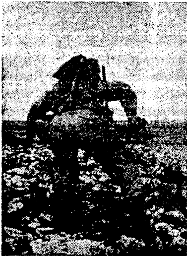
באימונים: התקדמות בקפיצות-קרב

כאמור, ממלאים ישובי-הספר תפקיד נכבד ב-מערך כוחות-הבטחון, הן למקרה של התקפת-פתע מצד האויב והן לצרכי הבטחון השוטפים של המדינה: מניעת הסתננות, הבטחת דרכי תחבורה והבטחת אווירי-ההתישבות שבעורפם. היושב בספר צריך