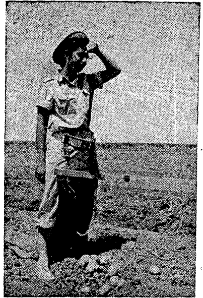
בעבודה חקלאית: איסוף תפוחי-אדמה

האימון הטרומי-צבאי הניתן בגדנ"ע הוא צורך מוכר על ידי תנועת-הנוער. אין התנועה מוללת, חלילה, בצורך באימון הטרומי-צבאי. בראותה לנגד עיניה את האדם המתישב, ובמיוחד את זה שעתידי להתישב בספר, חרדה היא לאימונו ואף על פי כן "חתול שחור" עבר כאילו בין התנועה לגדנ"ע. ה"גדנ"ע, מצדו, אף הוא שואף, לינוק מערכים חלוציים, מהוי המתאים לנערים בגיל זה — הוי אשר טופח וגובש בתחומי תנועת-הנוער, אף אילו הסכמנו לדעה האומרת שחינוך צבאי ניתן רק בקסרקטין, וכל כוחו ב"משמעת-ברזל" ואיננו נוקט כלל לענינים שברוח ובנפש — גם אז צריכים היינו להכיר בשוני שבין חינוך מבוגרים אנשי צבא לחינוך צעירים-מתבגרים. חינוך טרום-צבאי בכלל, ובמיוחד בגדנ"ע שלנו, מטפח — אם במידה קטנה ואם במידה גדולה — זיקה לערכים חלוציים ולחיי חברה עצמאיים. משמע, שיש לשון משותפת בין תנועת-הנוער ובין הגדנ"ע. ואם לשון-המושגים, כאמור, משותפת — כי אז גם ההכרה בזכותו של הצד השני להתקיים ולפעול —