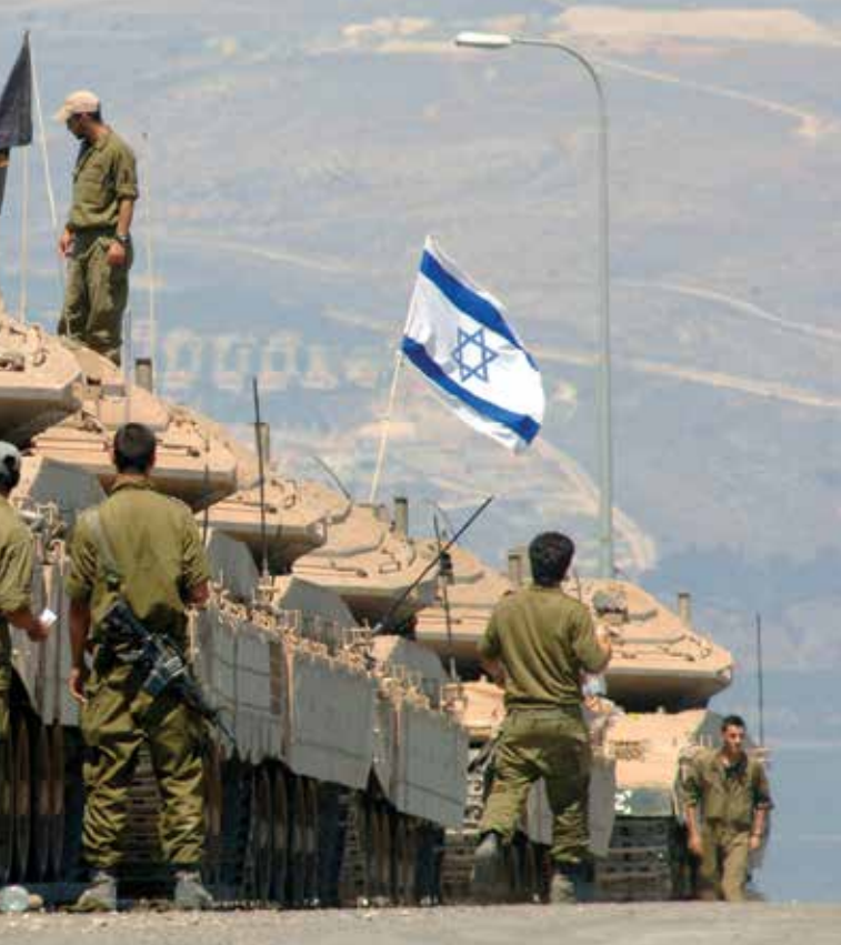
לוחמים במהלך מלחמת לבנון השנייה. "לא הייתה בעיה אמיתית של מחסור בפריטי

קדמיים. אלה נועדו לקצר את זמן היערכות כוחות המילואים בעיקר אבל לא רק, שכן התבצעו נוהלי קרב בקרב הכוחות החל ממאי עד אוגוסט 1973. מעבר להיערכות זו לא נעשה דבר בהכנה המקדימה, וכפי שניתן לראות בעדות של אלוף אברהם אדן בוועדת אגרנט, מפקד עוצבת הפלדה במלחמת יום הכיפורים, במהלך הקרבות סבל צה"ל מנחיתות במספר החיילים ובהספקת הציוד שעמד לרשות הכוחות. 5