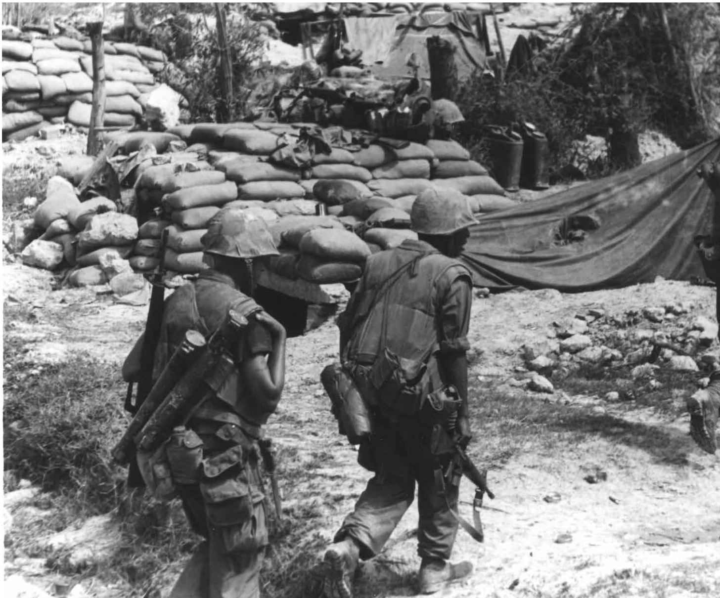
מתקפת טו. הקיצוץ במשאבים פגע בכל התמיכה ההספקתית, והביא את הכוחות למצב שבו פעילות מבצעית לא יוצאת לפועל בעקבות חוסר בדלק ובתחמושת

ארצות-הברית מבסיס בעיר הוואי למשך יותר מ-24 שעות. בסופו של דבר נסוג צבא צפון וייטנאם בעקבות מחסור בתחמושת, שכן לוחמי הצפון נשאו עליהם תחמושת לשלב התקיפה אך לא לאחיזה בבסיס. כמו כן הם לא תכננו נתיב קרקעי, תתיקרקעי או אווירי לתספוק הכוח בשלב שלאחר הפריצה. מנגד עמד צבא ארצות-הברית, שההסתמכות על כוח אש מסיבי ועל עליונות טכנולוגית והיכולת לגייס משאבים לוגיסטיים עצומים היו סימני היכר שלו. 2 בווייטנאם פגש צבא ארצות-הברית מצב של חוסר במשאבים ופגיעה במענה לכוחות, עד לכדי מצב שבו נשיא דרום וייטנאם אמר שהוא צריך להילחם "מלחמה של האיש העני". 3 אמירה זו הגיעה לאחר קיצוץ תמיכת הקונגרס בלחימה בווייטנאם שהחל ב-1973 ונמשך עד 1975.