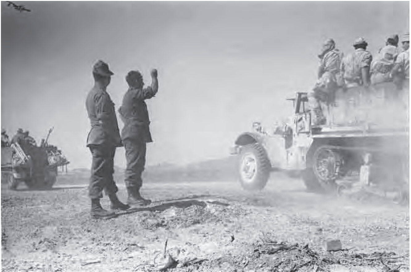
צנחנים בציר כונתילה - מתלה, 1956. ניתן להכריע את האויב תוך שימת דגש על שלילת יכולותיו - גישת שחיקה - וניתן לעשות זאת תוך מתן דגש על שלילת רצונו - גישת תמרון