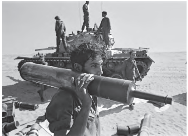
חימוש טנקים, 1973. אסטרטגיית צה"ל העדכנית מינואר 2018 מתווה שתי גישות ברמה האסטרטגית: גישת המניעה וההשפעה וגישת ההכרעה

של גישת התמרון חייב לעצב כבר היום את היבטי בניין הכוח, בשלוש הרמות: האסטרטגית, המערכתית והטקטית.