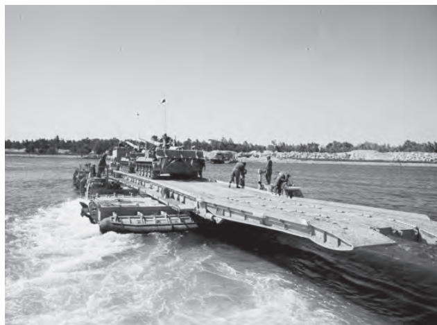
חותחים בתנועה, 1973. למיצוי התמרון הטקטי נדרשת גישת פו"ש המבוססת על "פיקוד משימה"

אסטרטגיית צה"ל העדכנית מינואר 2018 מתווה שתי גישות ברמה האסטרטגית: גישת המניעה וההשפעה וגישת ההכרעה. גישות אלה מקיימות קשר הדוק עם רעיונות היסוד של הביטחון הלאומי, ומחזירות ללב הבמה את הצורך לסיים כל עימות בהכרעה צבאית מהירה (ההתייחסות היא לעימותים בעצימות בינונית או גבוהה.