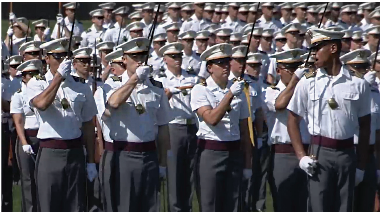
מסדר סיום בווסט פוינט. קורסי המפקדים בצבא ארצות הברית שופרו, הוארכו והפכו להיות חלק בלתי נפרד מתהליך ההתקדמות המקצועי של מש"קים

ניסיון מעשי, ו"זוכים" להכשרה לקויה. יכולת השליטה של המ"כ תלויה באופן בלעדי בתקשורת שמתבססת על ראייה-דיבור, ואולם בפועל נבצר ממנו לקיים קשר רדיו. מפקדיו של מפקד הכיתה מכרסמים תדיר בסמכויותיו בשגרה ובבט"ש ככל שמתאפשר להם, ונפוצים המקרים שבהם מ"כים נאלצים לנוע בין תפקידי פיקוד לתפקידי חייל. 8 לכך מתלוות ההשפעות השליליות הנוגעות לתפקידו בהיבטים של סמכות, מוטיוויציה ובהירות המדרג הפיקודי. מ"מ המודח מתפקידו לא יהפוך לחייל מן השורה במחלקה אלא ייפלט מהיחידה. מ"כ שמודח מתפקידו, או אפילו מאבד אותו בגלל מחסור בחיילים, צפוי להישאר באותה יחידה, ללא סמכות לפקד על החיילים שעליהם פיקד בעבר. כפועל יוצא, העומס המוטל על המ"מ והצורך שלו לפעול בצורה חופפת, ואף להחליף את המ"כים שלו בשגרה ובחירום, מביאים לצמצום ניכר בגודל המחלקה. רוב מחלקות החי"ר בסדיר נמצאות מתחת לשני שלישים מהתקן שלהן, 9 שכן מרחב יכולת השליטה הישירה של המ"מ מונע ממנו לטפל בצורה יעילה בסד"כ מחלקתי מלא. ביחידות אחרות הפך צמצום הסד"כ לשיטה: 10 בחטיבת הצנחנים צומצמו מחלקות החי"ר לסד"כ צוותי - אותם סד"כ שעליו מפקד היום מ"כ במרינס - לטובת הגדלה של מספר המחלקות בפלוגה. בסופו של דבר, עיקר העומס הפיקודי נופל על המ"פ, בהיותו הוותיק והמנוסה, או על המ"מ, שנדרש לפקד על כלל הסד"כ במחלקות ללא הסיוע הנדרש לכך ממפקדי הכיתות, בעוד שליטת המ"כים מצטמצמת והם נדרשים לפקד על מספר חיילים קטן אף יותר. ביחידות המיוחדות, כדי לִמְטב את היחס בין ניסיון המפקדים ובין מספר פקודיהם, מספר הקצינים הלוחמים עולה בהתמדה, ובחלק מהיחידות כלל