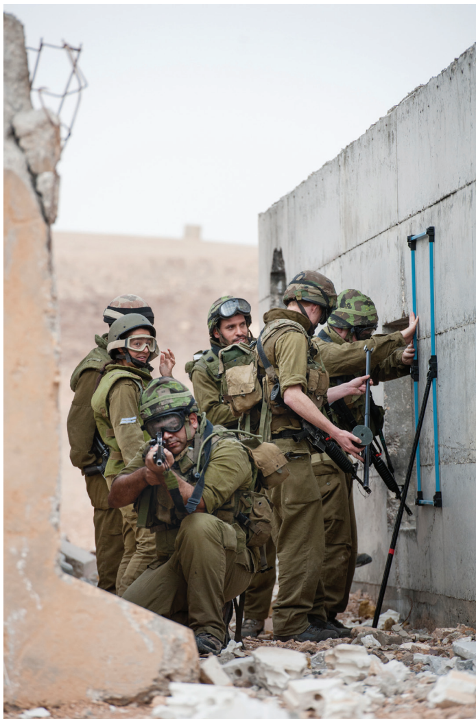
לוחמים באימון. מפקדים שלא מסוגלים לפקד על חיילים בשגרה לא יוכלו לעשות זאת בחירום

להקטין את התופעה בגזרתו - שימוש במחלקות המחזוריות - נוסה אף הוא על-ידי הצבא הסובייטי, באותה מידה של חוסר הצלחה ושל פגיעה במעבר של הידע המקצועי בין חיילים ותיקים לצעירים. 18 מפקדים שלא מסוגלים לפקד על חיילים בשגרה לא יוכלו לעשות זאת בחירום, וכל עוד המפקדים יהיו בני גילם של החיילים האתגר ימשיך להיות קשה. ניסיון דל וידע מקצועי לא מספק הם מוטב חוזר בקשיים של הפיקוד הזוט, אלא שאין להתפלא על כך. משך שירות של 32 (והיום 30) חודשים מקשה מאוד על הקניה נאותה של המקצועיות הנדרשת לפיקוד הזוט, ומכיוון שאין בצה"ל שכבת נגדים לוחמים, בניגוד לכל צבאות המערב כולל אלה הבנויים על גיוס חובה, הרי הכשרת הלוחם, המפקד והפיקוד על החיילים בפלוגות מבצעיות נופלת על מפקדים בחובה. לפיכך, אף שמסלולי ההכשרה של החיילים והמפקדים הם הארוכים בעולם המערבי, יתרת שירות קצרה של מפקדים (18 חודשים לכל