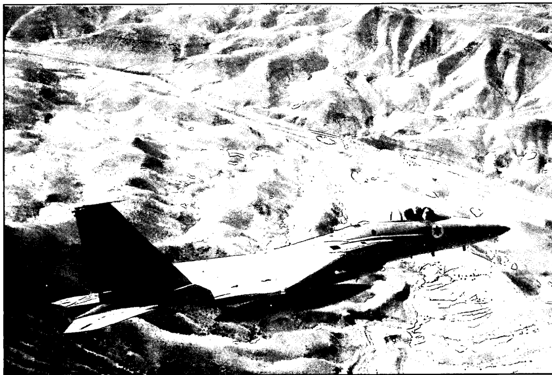
F-15 של חיל האוויר – ישראל צריכה להמשיך להתמקד בבניית הכוח באותם תחומים שבהם יש לה עליונות מסורתית

"הגורם השני שהביא אותי למסקנה, שהאפשרות היחידה הניצבת בפנינו היא פעולה מוגבלת, היה מגבלותיהם ההתקפיות של טילי ה'סאם' שלנו... למדנו על בשרנו ב-1956 וב-1967 באיזו קלות ניתן להביס כוחות קרקע חשופים בהעדר חיפוי אווירי יעיל... ההיגיון חייב שכל התקדמות של כוחותינו מזרחית לתעלה תסתייע בהגנה אווירית המבוססת על טילי 'סאם'. לפי מיטב שיפוטי, יכולנו – לאחר הכנות נאותות – לחצות את התעלה ולהתקדם כ-9 או כ-12 קילומטרים מבלי לצאת מתחום מטריית טילי ה'סאם', אשר יועברו במהלך הקרב לעמדות שדה, שניתן יהיה להכין במהירות סמוך לקו המים בגדה המערבית של התעלה. אך בקו זה יהיה עלינו לעצור, לבצר את כוחותינו ולארגן את הגנתנו האווירית. ניסיון להתקדם בכוחות קרקע מעבר לקו זה ללא טילי 'סאם' ניידיים, שיעניק להם הגנה אווירית מדלגת, הוא מתכון בטוח לאסון".