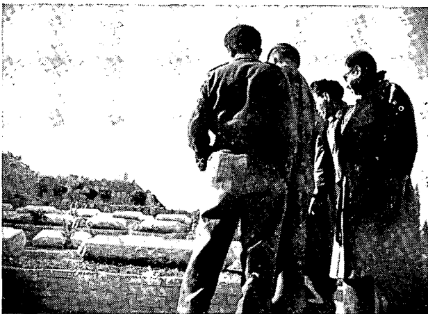
ביקור בהר המנוחות

נוסף לחשד ההדדי היה בתוך המחנה ניגוד חריף בין