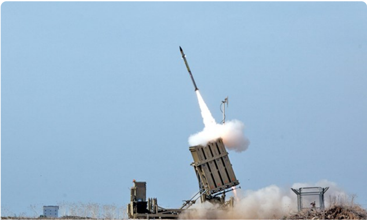
מערכת "כיפת ברזל" במהלך יירוט טילים מרצועת עזה