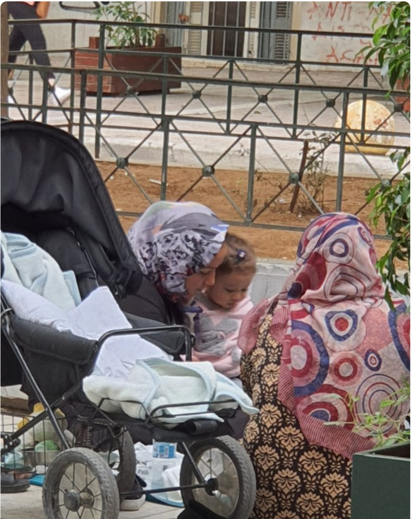
פליטים ברחובות אתונה.