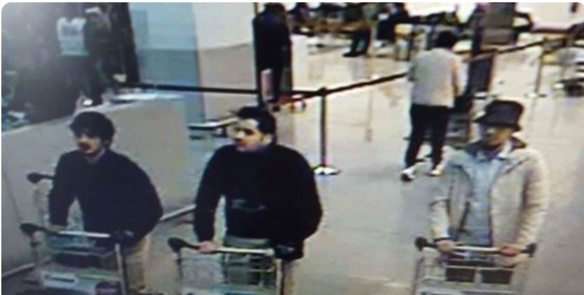
מבצעי הפיגוע בשדה התעופה בבריסל כפי שנצפו במצלמות האבטחה

נוכל לטעון ש"טרורזים של פליטים" מקורו באוכלוסייה נודדת, חוצה ארצות ויבשות, ללא שייכות מדינתית ובניסיונות להתחמק מרישום. נוסף על כך, מדובר באוכלוסייה המגיעה מאזורי עימות, לרוב ממדינות מוסלמיות שנושאת פער אידיאולוגי, תרבותי ודתי בין המקום שממנה היא מגיעה והמקום שאליו היא שואפת להגיע. כפי שניסח זאת סלבוי ז'יז'ק במסה שכתב מייד עם פרוץ משבר הפליטים: "לא כל הפליטים יגיעו לנורווגיה, והנורווגיה לה שוחרים - לא קיימת". 10 במילים אחרות, לאן שהפליטים רוצים ללכת לא ניתן להגיע, וספק אם המקום שעליו הם חולמים קיים כאופציה מבחינתם. התוצאה - הם יישארו במקומות שאליהם לא רצו להגיע. הפליטים שנמלטו מאזורי עימות כבר הוכיחו מעל לכל ספק, שהם מוכנים לסכן את חייהם למען המטרה. לצאת לים הפתוח בסירות רעועות, לחצות גבולות באישון לילה תוך כדי סיכון במוות מידי ולצעוד באזורים חמים ימים רבים בחוסר ודאות. זאת למעשה נקודת המוצא המשותפת לפליט ולטרוריסט - מציאות בלתי אפשרית שהוא לא מוכן להשלים עימה.