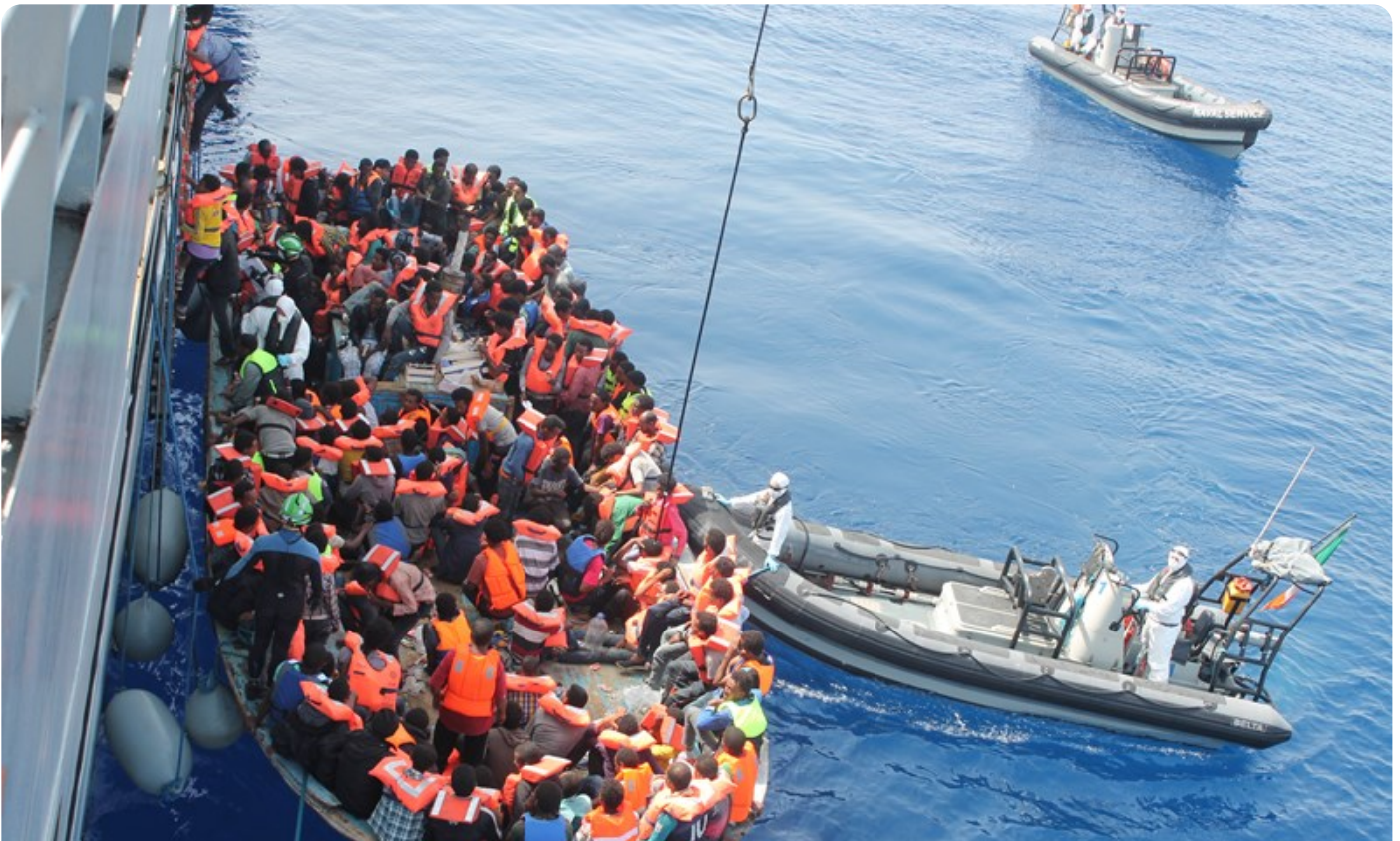
חילוץ מהגרים מאפריקה על ידי אנשי משמר החופים האירי, יוני 2015