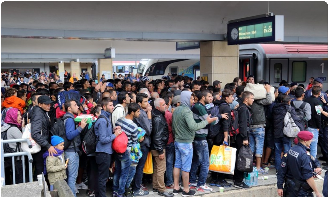
פליטים בתחנת הרכבת וינה מערב, ממתינים לרכבת שתיקח אותם לגרמניה, 5 בספטמבר 2015

למשבר הפליטים השלכות על ישראל הן בסוגיה של הגנת גבולות והן בהקשר הרחב יותר של התמודדות עם טרור אסלאמי. התופעה של פליטים רבים המגיעים לכל מדינה באירופה מארצות שמחזיקות בגישה אנטי-ישראלית צריכה לייצר בישראל לפחות מודעות לבעיה, גם אם האיום נראה רחוק.