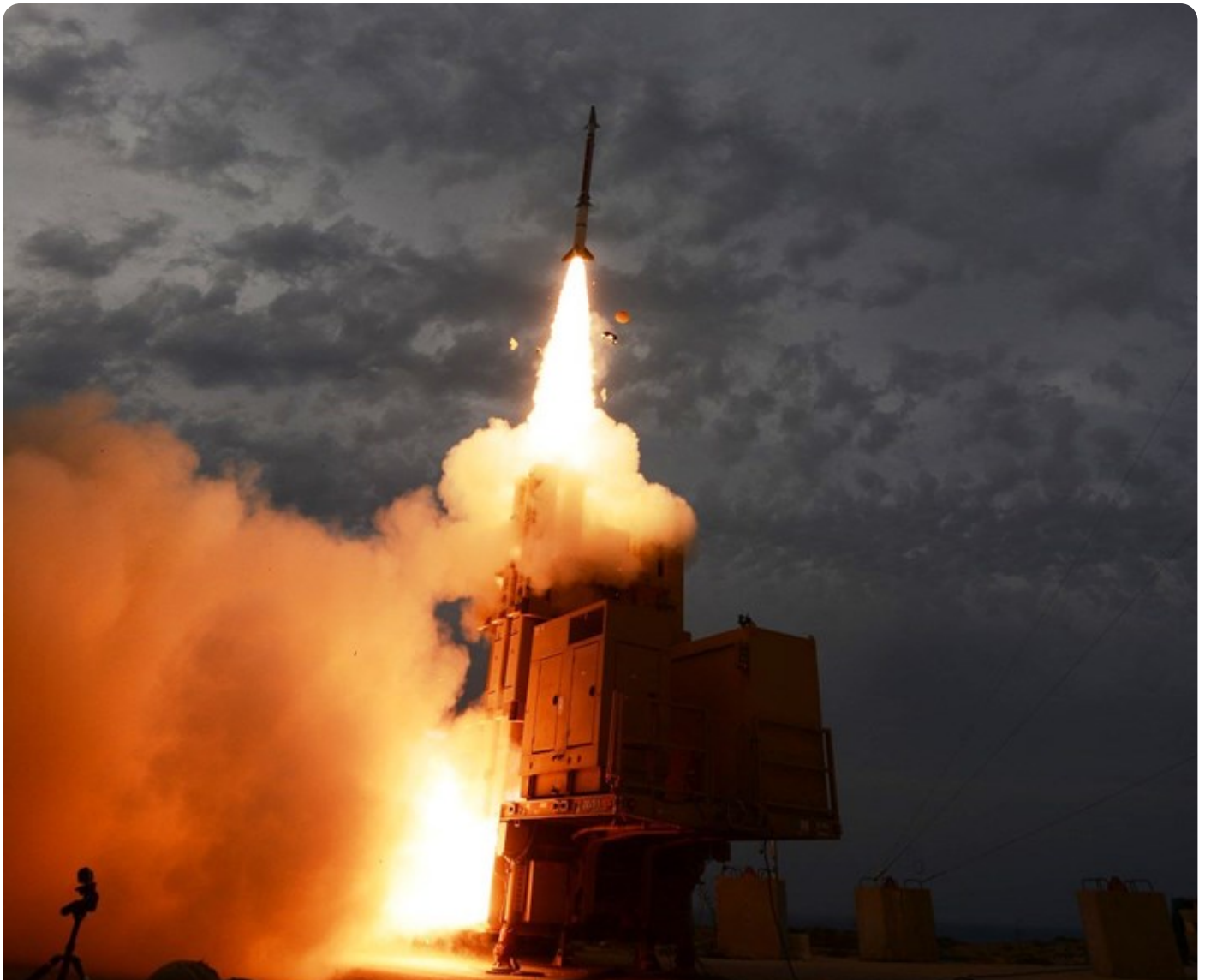
מערכת ההגנה האווירית "קלע דוד" (שרביט קסמים)

כאשר קצב הופעת איומים חדשים גדל במהירות, נדרשים מפתחי ומפעילי מערכות ההגנה האווירית להביט קדימה ולממש פתרונות בזריזות. לקחי העשורים האחרונים מצביעים כי התלקחות אזורית בתזמון שבו אין עדיין מענה לאיום החדש, תסתיים בצורה כואבת, ולעיתים - גם ברמה האסטרטגית