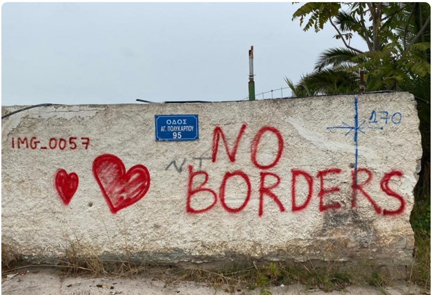
גרפיטי באחד ממחנות הפליטים

לכל אלה יש להוסיף את ההשפעה של משבר הקורונה על סוגיית הפליטים. מנתונים של סוכנות האו"ם לפליטים רואים שב-2020 פחת זרם הפליטים המגיעים ליוון באופן משמעותי. ייתכן שבשל הסגר שהטילו המדינות בעקבות התפרצות הנגיף. ואולם ההשפעה של הקורונה על הפליטים תהיה בוודאי בהיבט אחר - הפן הכלכלי. 20