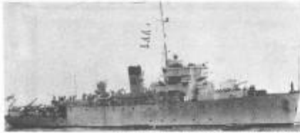
שולת המוקשים שליוחה את "האמיר פארוקי"

"באותו רגע קריטי, תוך שבירור של שניה, החלטתי לטובב את ההגה ככלוא כוח, כדי לבצע סיבוב שלם נוסף, ולהתעורר שנית כמלוא המהירות לעבר רוסן אניה הקרב, כשהחומר הפצץ עומד להתפוצץ בכל רגע. הזמן שעמד לרשותי היה כשלוש דקות וחצי. תוך עשיית הסיבוב המסחרר ראיתי קיטור מודבתי האניה. זו הייתה הפנימה המדויקת של אברטוב שהיחלה למעשה את אניה האויב. במרחק של 100 מטר מהאניה קפצתי למים, בלי שאדאג למצוף. ששעליתי עלי"פני המים מצאתי את עצמי בין מאות מצורים, כשלהבה גדולה עולה ממרכז האניה והיא כולה אפופה עשן, השתדלתי להתרחק מהמצורים, כשלהבה נתקלתי במצוף, עליתי עליו וצויתי לסירת האויף".