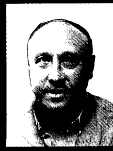
דוקטורנט ללימודי ארץ-ישראל

ההנהגה המדינית של הסוכנות עשתה מאמצים רבים לרכוש כלי נשק ותחמושת בחו"ל – בעיקר בגוש המזרחי, שהפגין אהדה למדינה שבדרך. כך הועברו מטוסים ונשק בעיקר מצ'כוסלובקיה, אך גם ממדינות אחרות באירופה ובאמריקה. תפקיד מיוחד מילאה יהדות דרום-אפריקה,