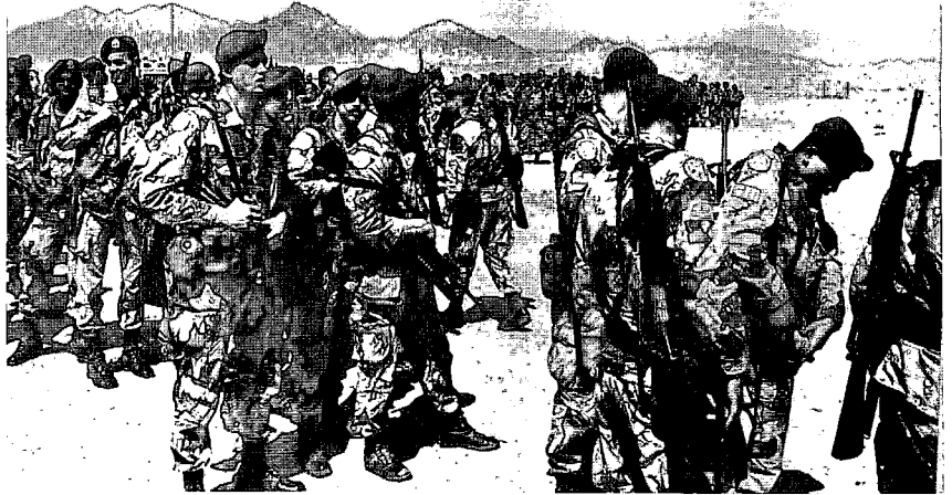
חיילים אמריקניים מהכוח הרב-לאומי בשעת הגעתם לסיני

אף כי לא ברור עדיין מה תהיה מידת הצלחתו של הכוח הרב-לאומי בסיני, נראה כי עצם הרעיון נקלט בקהילייה הבין-לאומית. עדות לכך ניתן למצוא בהצעות המועלות בימים אלה להציב כוח רב-לאומי בדרום לבנון.