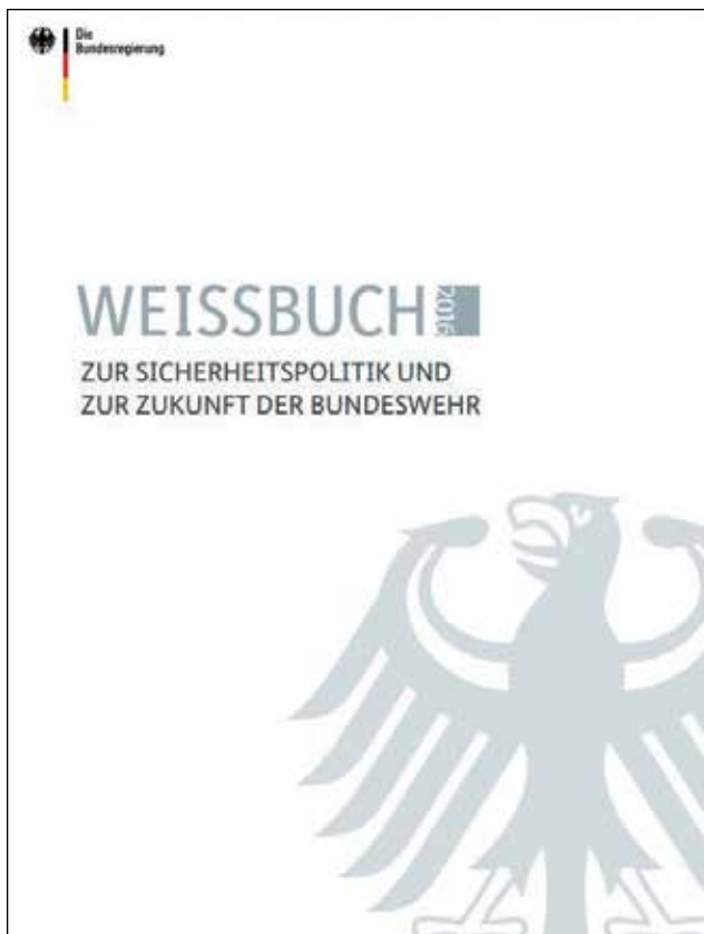
"הספר הלבן הגרמני. הספר נועד להכווין את מדיניות הביטחון של המדינה ולהגדיר את המשימות לצבא הגרמני

יעילים. 19 כדי לתמוך בתוכנית זו פיתח הצבא הגרמני תוכנית למבצע את שתי האוגדות המתמרנות שלו עד 2032. במסגרת התוכנית 20 כל אחת מהאוגדה תכלול חמש חטיבות מלאות, במקום השלוש שהיו בתחילת 2014.