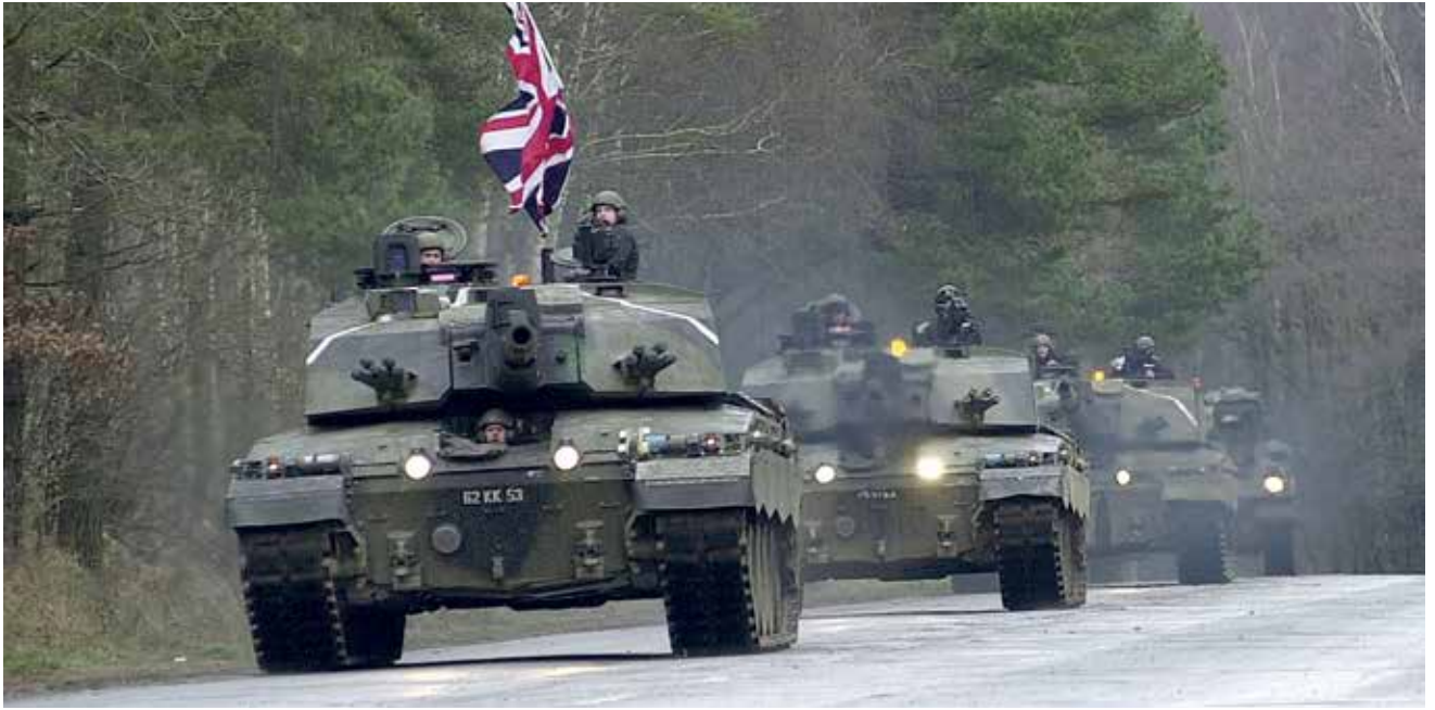
טנקי צילנר 2 באימון בגרמניה. להתאים את משימות הצבא לציפיות של המדינאים (צבא גרמניה), או לפעול בפרדוקס: להשקיע בבניין כוח שלא משרת אותו במלחמה (צבא בריטניה).

אפשר לראות שצבא היבשה הבריטי פיצל את בניין הכוח שלו לשני תהליכים שיאפשרו לו להיות רלוונטי למקבלי ההחלטות המדיניים בשגרה, ובה בעת להתכונן באופן מוגבל למלחמה. הדרך של צבא בריטניה לשמור על הרלוונטיות שלו היא להפריד בין הכוחות ולליעד כל אחד מהם למשימה ספציפית. זאת מתוך הנחה שאפשר להשתמש בעת מלחמה בחלק מהיכולות שיופעלו בזמני שלום.