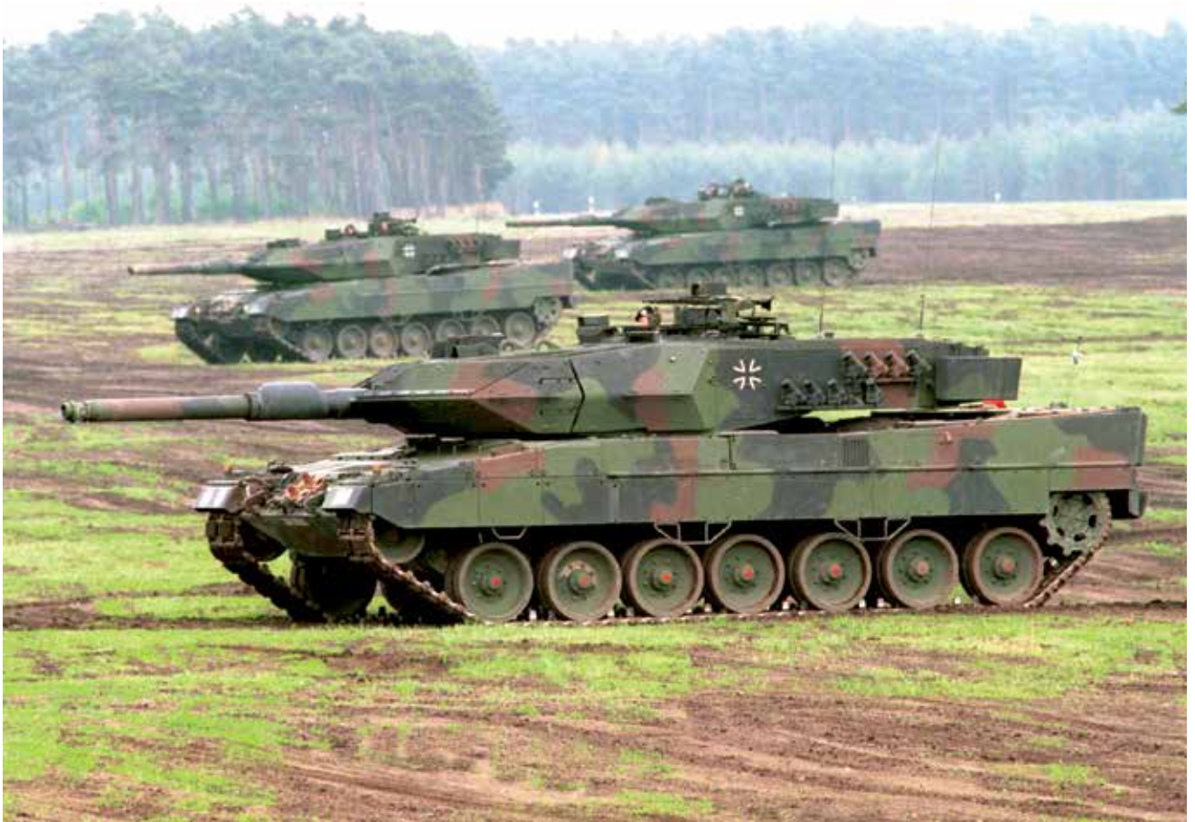
טנק לאופרד מתוצרת גרמניה. פער הרלוונטיות של צבאות היבשה נובע מכך שהם נבנים בזמני שלום ומיועדים למלחמה, וכדי לפעול בזמני שלום צריכים להסיט משאבים.