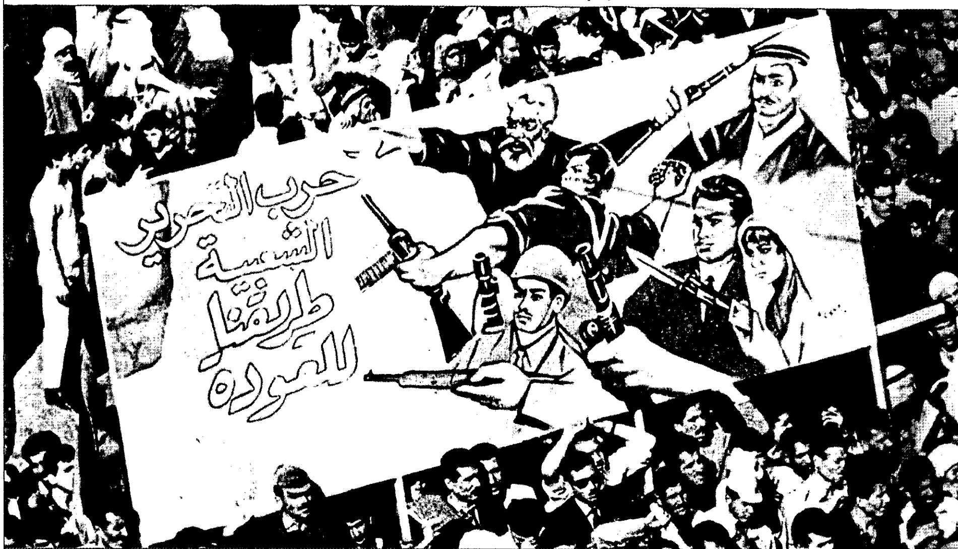
לאורך כל ההיסטוריה - בעת העתיקה ובעת המודרנית - נוצלו הפסיכולוגיה והתעמולה לצורכי המלחמה כאמצעי שכנוע לא אלימים לקידום יעדי המלחמה

בשופרות, ניפוץ כדים ומצעד לפידים. כך הצליח לגבור על הצבא המדייני הגדול, אף שעמדו לרשותו רק 300 לוחמים. 7 לאורך כל ההיסטוריה - בעת העתיקה ובעת המודרנית - נוצלו הפסיכולוגיה והתעמולה לצורכי המלחמה כאמצעי שכנוע לא אלימים לקידום יעדי המלחמה. יש לכך דוגמאות משתי מלחמות העולם, מהמלחמה הקרה, ממלחמת וייטנאם וכד'. בעת החדשה עודכנו המונחים השונים וקובצו תחת