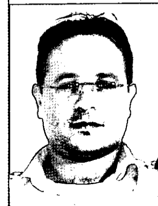
ראש ענף בחיל האוויר

יהיה זה מגוחך לבסס תיאוריה המניחה שבגין הטכנולוגיה אנו יכולים להתעלם מהכוחות