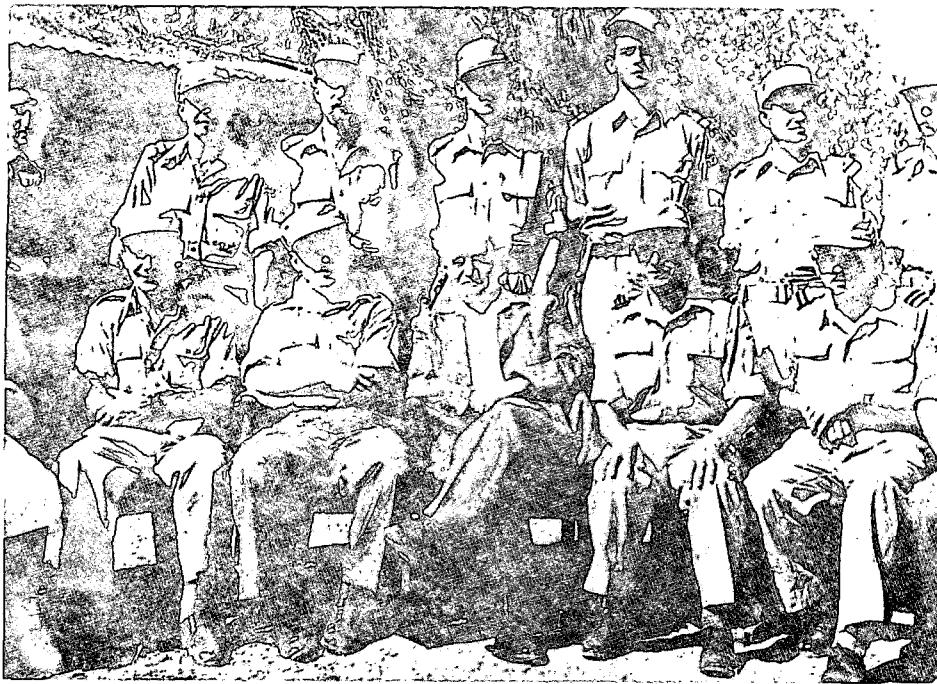
בן-גוריון עם קציני חיל-האוויר

הגדרה מחודשת של מבנה ומעמדו. התפתחות גדולה הייתה ברכש. ביולי עמדו לרשות ישראל 30 מטוסים קלים ותשעה מטוסי-קרב מדגם מסרשמידט 30 . במקביל התחילו כל הקורסים של חיל-האוויר: קורס קצינים ראשון, התחלת בית-הספר הטכני והתחלת בית-ספר לטיסה. הדבר אמור גם בכוח-האדם שעבד בחיל. מ-900 אנשים ששירתו בחיל בסוף מאי הגיע המספר בסוף יולי ליותר מאלפיים 31 . ממאי ועד יולי נהפך חיל-האוויר מחיל דל לכוח אווירי בעל עוצמה גדולה ביחס לנסיכות התקופה.