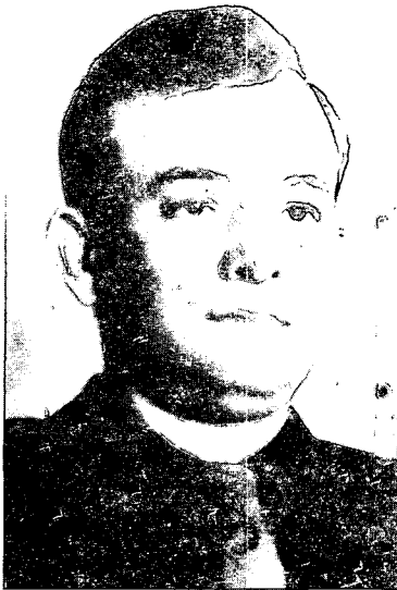
אהרון רמז, מפקד חיל האוויר מ-1948 עד 1951.

המטוסים, אך הוא צימצם את האפשרויות להפעלתם בנגב ובגליל, מחמת המרחק. כדי לנצל היטב את הסיוע במטוסים היה צורך להעביר חלק מהם או כולם למרחבים אלה. הגידול בצוותי האוויר והקרקע ובמספר המטוסים איפשר לפצל את הטייסת בתל-אביב לשלושה גפים. ב-12 במרס הוחלט להעביר שני מטוסים לנגב. כך נוצר גף הנגב והוצמד למפקד חטיבת הנגב. ב-4