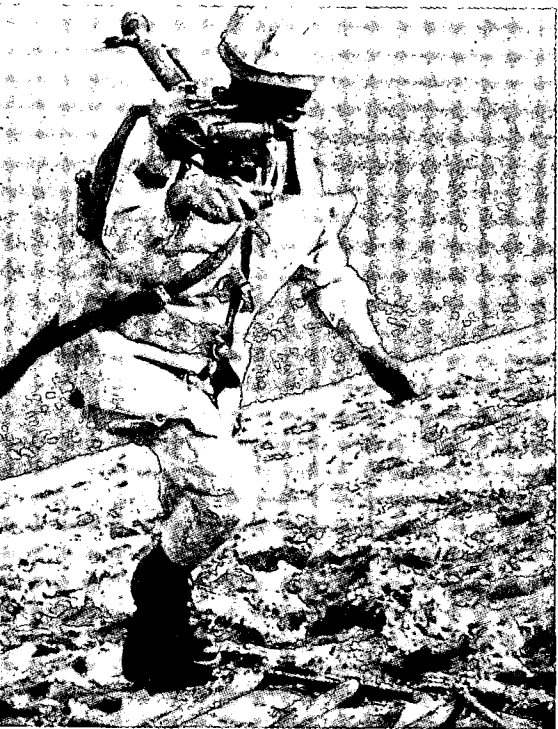
חייל מצרי במעבר סוללה בעזרת סולם עץ

ובירידה לקו המים, אולם הדברים לא התפרשו כמסע התקרבות ארוך, המצביע על שעת הפתיחה באש. כל הכוח של הגל התוקף הראשון היה קרוב מראש לנקודת הצליחה של המצרים. המידע שהועבר לכוחות כאילו ההתקפה צפויה בשעה 1800 ג' והוא לא בוטל. מכאן שבמצב כוננות כזה יש לצפות לתחילת לחימה בכל עת, ולאו דווקא בשעה מסוימת כמו 1800.