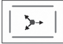
תנודתיות עדינה במרחב המחיה

החוקים והמוסכמות הם כלים בידינו לחידוד אותם הגבולות ולהתוויית מיקומה המדויק של המסגרת, ואילו המשמעת עוזרת לנו להתמקם באותו מרחב מחיה ובמידה רבה גם קובעת את אופן התנועה שלנו בו. במילים אחרות: נקודת ייחוס על ציר המרות הקרובה מאוד לקצה הימני גוזרת תנועה עדינה במרחב המחיה, כזו המקבילה לגבולותיו וכלל לא מתקרבת אליהם. מנגד, נקודת ייחוס הקרובה לקצה השמאלי של הציר תייצר תנועות יתר בתוך מרחב המחיה, ובמוקדם או במאוחר תפרוץ זו את המסגרת באופן בלתי נשלט. (ראה איורים 2 ו־3).