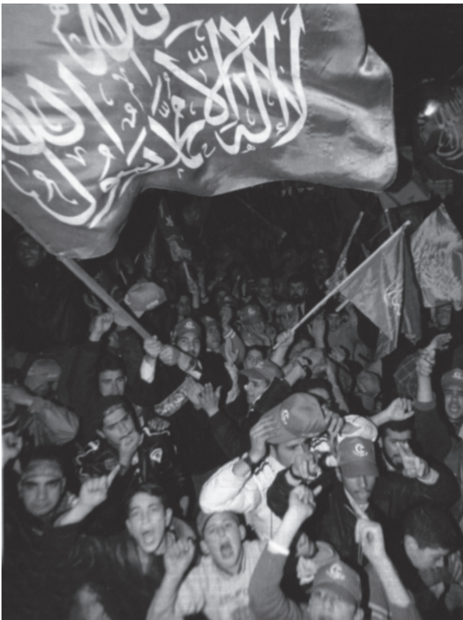
תומכים משולהבים של חמאס בחברון | אל לנו לצפות כי נצליח לשנות את חזונם ואת אמונתם. חלומות גדולים אינם ננטשים, הם לכל היותר רק נדחים