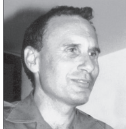
אלוף גרשון הכהן מפקד המכללות

אויבינו מונחים על-ידי חזון-על, אבל הם פועלים להגשימו בזהירות רבה, מתוך התחשבות מתמדת במציאות. אז מדוע אנחנו מתעקשים לטעון כל הזמן שהם פועלים באופן לא רציונלי?