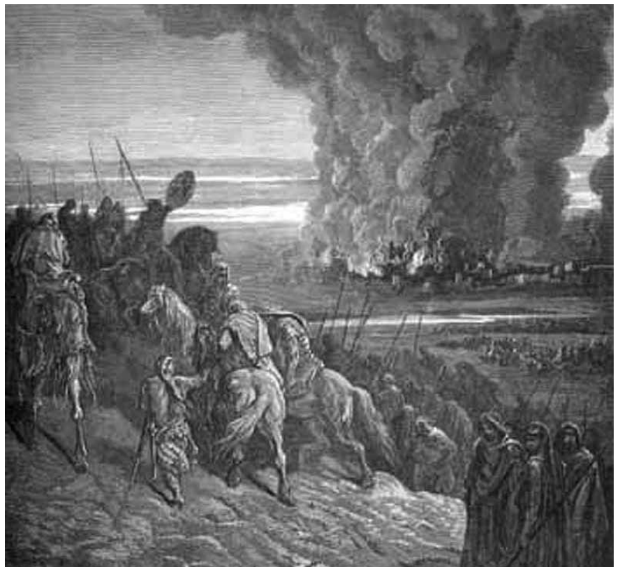
העי עולה באש. תחריט של גוסטב דורה, 1830-1883 | "וַיֵּט יְהוֹשֻׁעַ בְּכִידוֹן אֲשֶׁר בְּיָדוֹ אֶל-הָעִיר. וְהָאוֹרֵב קָם מִהֲרָה מִמְּקוֹמוֹ וַיִּרְוּצוּ, כְּנִטוֹת יָדוֹ, וַיִּבְאוּ הָעִיר, וַיִּלְכְּדוּהָ; וַיִּמְהָרוּ, וַיִּצִיתוּ אֶת הָעִיר בְּאֵשׁ"

קרב בעת העתיקה היה לרוב התנגשות חזיתית בין צבאות יריבים בזירה אחת. בדרך כלל לא התרחשו התנגשויות נוספות בזירות משנה. כך, למשל, בקרבות ידועים כמו מרתון (490 לפנה"ס), קרב לאוקטרה (371 לפנה"ס), ארבלה (331 לפנה"ס) או קנאיי (216 לפנה"ס) הצבאות לא התפצלו, גם אם הצבא החלש יותר או הקטן יותר תקף מהאגף או במדורג וזכה כך בניצחון. 10 ההיגיון לכך ברור: ככל שמספר הלוחמים של צד אחד בתא שטח מסוים היה גדול יותר, סיכוייהם לגבור על יריביהם היו גדולים יותר (עקרון ריכוז הכוח). לכן מי שפיצל את כוחותיו, הקטין את מספר לוחמיו בתא השטח האמור - מה שהקטין את סיכוייו לנצח בקרב. במילים אחרות, הנחת העבודה של מצביאי הכוח החזק אמורה הייתה להיות שיריביהם לא יפצלו את כוחותיהם, ולכן אין צורך להתכונן ולהיערך בחזיתות נוספות. ההנחה הזאת יכולה הייתה להיות נקודת